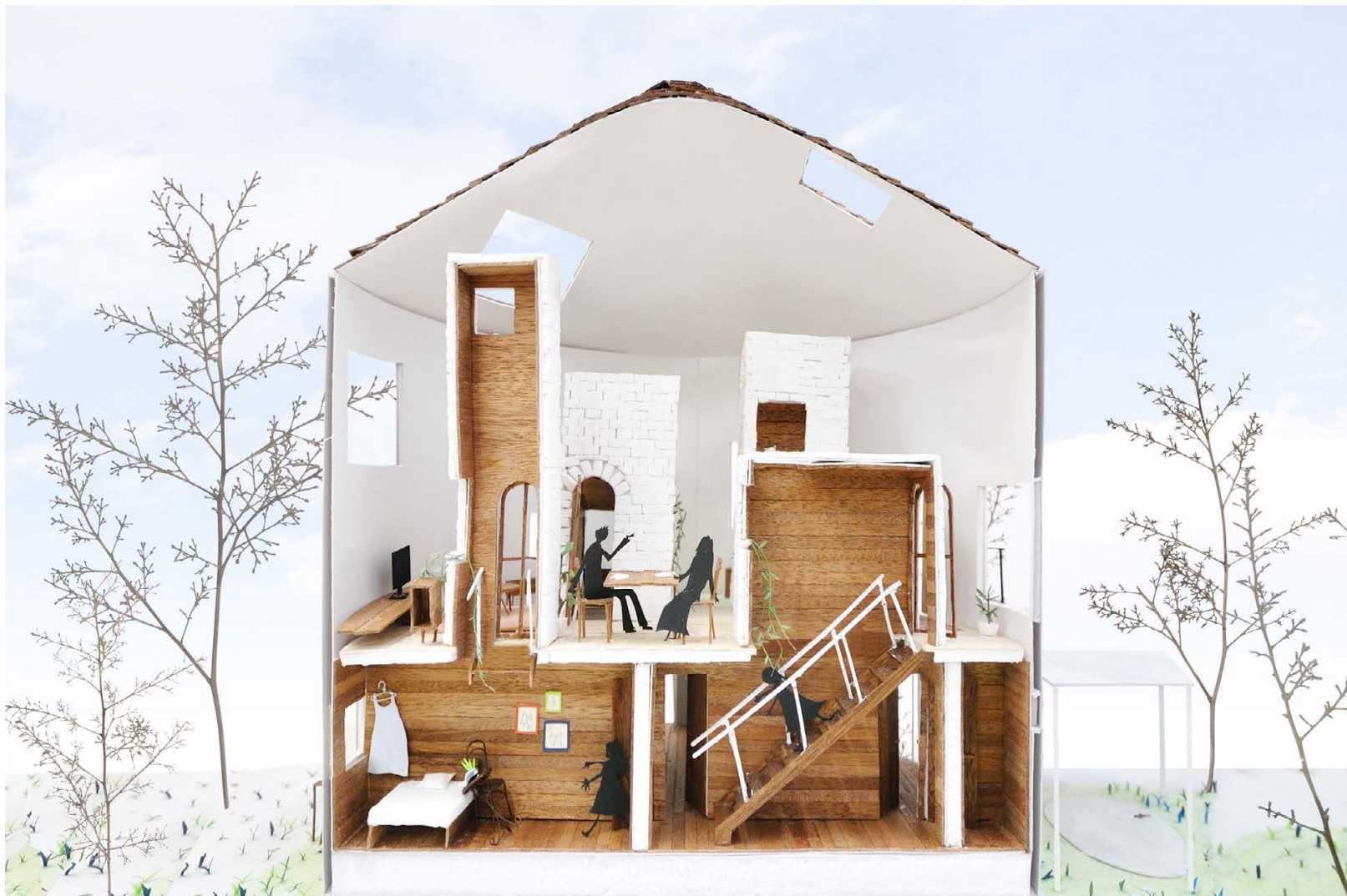
↑ A többszintes ház dekonstrukciója, 2011, családi ház, Suppose Design Office, Japán, Kanagawa, Chigasaki

építész szerint mindez azért problémás, mert olyan, hogy átlagember, valójában nem létezik. Friedman az egész várost és a benne lévő embert vizsgálta, és az urbanizáció problémáira kínált megoldásokat. Munkáiban egy futurisztikus világot képzelt el, ahol az egyén maga alakíthatja ki otthonát. Ennek ellenére a mai napig tartja magát az építészetben az a megközelítés, amelyben az emberek működése a terek által meghatározott rendben történik. Az, hogy mi a lakás és mit jelent lakni, igen komplex kérdés. Az emberek nem munkával töltött ideje például nehezen átlagolható. Természetesen szükség van a fürdőszobára és a konyhára. De mire jó például a nappali? Vajon tényleg ezek a szükségletek, amiket ki kell elégítenie a lakásnak? Az életünk arról szól, hogy alszunk, eszünk, mosakodunk és pihenünk?