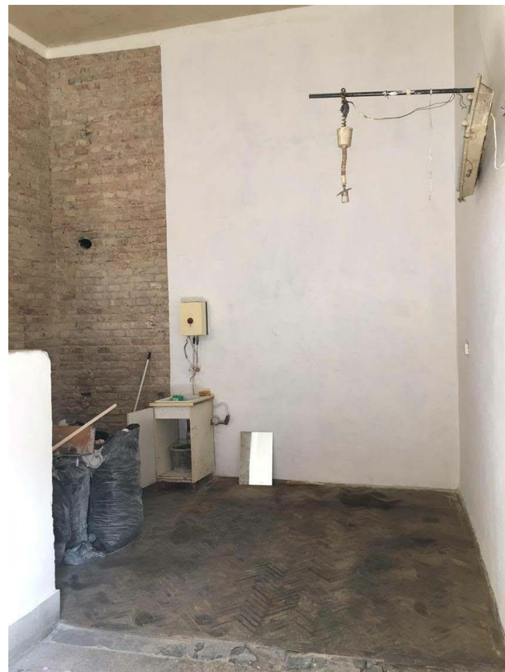
↑ OLTAI Kata