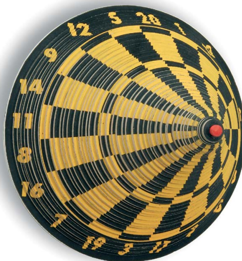
Laurent PERBOS: Egy pont az egész, 1996, céltábla, változó méretek A művész jóvoltából

A szimulákrum alakzata azért is illik ezekre a munkákra, mert minden sport önmagában illúzió: eredet nélküli másolat. Perbos általában olyan játékokat idéz fel, amelyek nagyon népszerűek, profi és amatőr szinten egyaránt tömegeket mozgatnak meg – szó szerint és metaforikusan is –, valamint jól körülhatárolható közterek kapcsolódnak hozzájuk. A foci, a tenisz, az asztalitenisz és a kosárlabda mind fontos gazdasági tényező, tornáik kimerítik