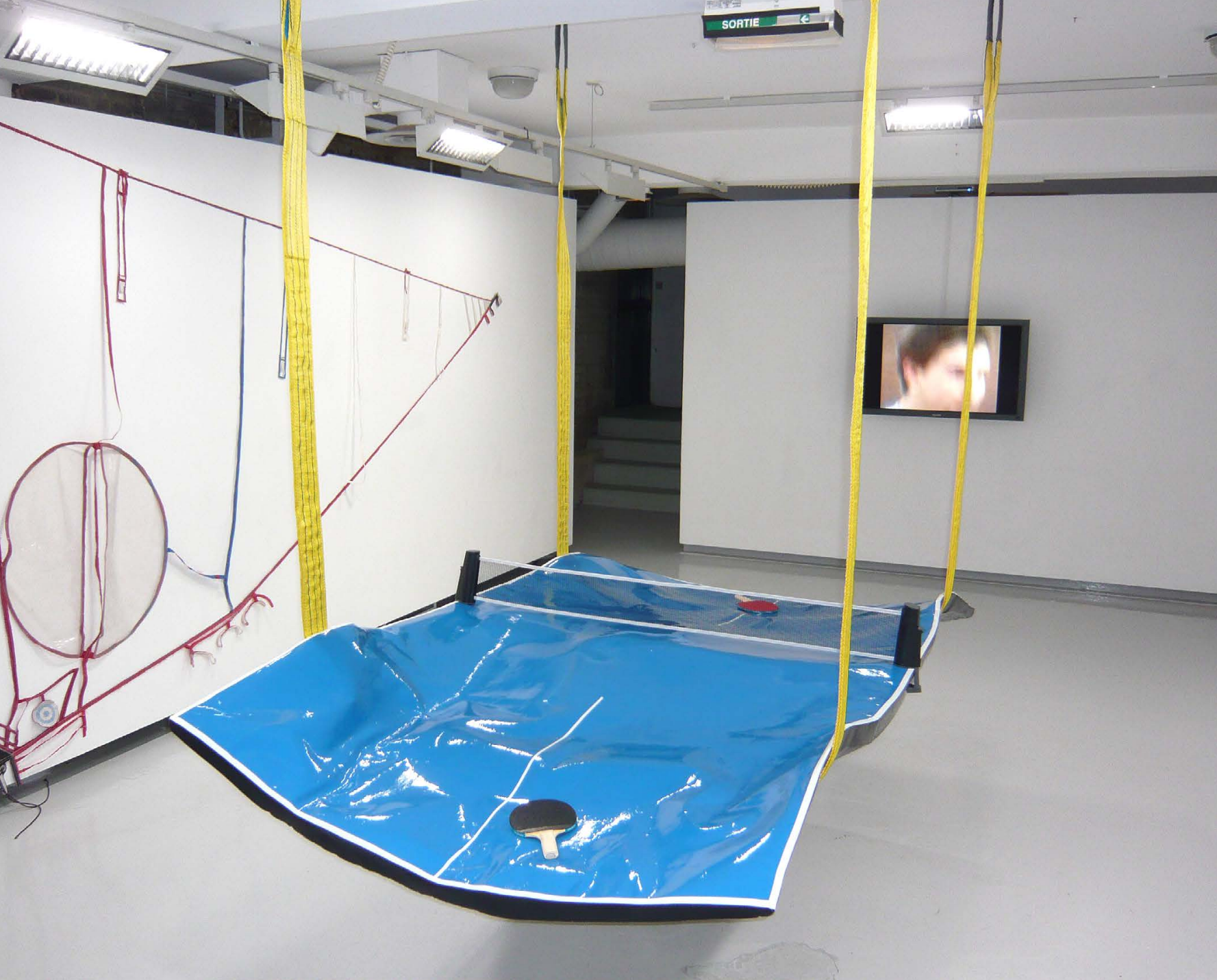
↑ Laurent PERBOS: Mentés , 2002, függő pingpongasztal, gyanta, karton, hevederek, 274×152×400 cm, kiállítási enteriőr A művész jóvoltából

a médiaesemény fogalmát, szimulákrumból spektakulomot hoznak létre, játékosai szupersztárok, követésük és művelésük az átlagemberek kedvenc tevékenységei közé tartozik. Ugyanakkor megmutatkozik bennük a sport kettős természete, hiszen eszünkbe jutnak a profi futball profitproblémái, a tenisz vélt vagy valós elitizmusa és rasszizmusa vagy a kosárlabdával kapcsolatos amerikai képek, amelyek a játékot a társadalmi leszakadás vagy felzárkózás koordinátatengelyei mentén értelmezik.