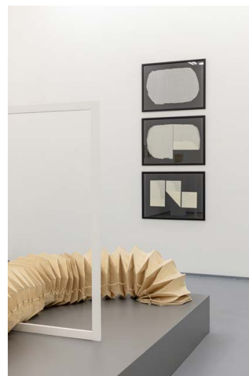
SZILVITZKY Margit: A négyzet megtalálása , 2021, acb Attachment

Szilvitzky Margit kiállítása acb Attachment, 2021. április 15. – május 21.