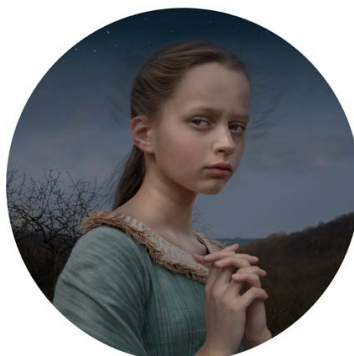
KATERINA BELKINA: Shedding Stars ( Fairy Tale: The Star Talers – Brothers Grimm ), 2019, 25x25 cm, giclée-print

Katerina Belkina egyéni kiállítása Faur Zsófi Galéria, 2021. május 3. – június 17.