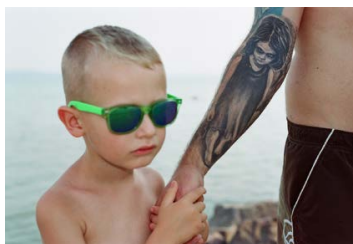
HERMANN Ildi: Tetoválások-sorozat , 2015–2018, fotográfia

INDA Galéria, 2021. április 23. – június 4.