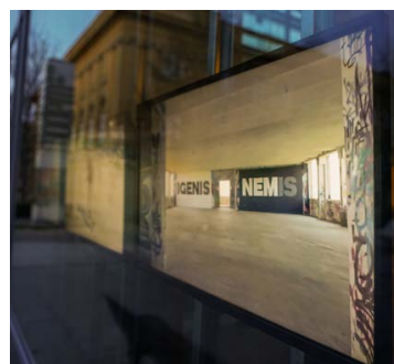
IMREH Sándor: Döntetlen (igenisnemis) , 2016, videó, 1'16"

Az üveg mögött MODEM, Debrecen, 2021. április 9-től