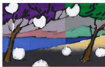
SZINYOVA Gergő: Untitled (The Last Undiscovered Place) , 2021, akril, vászon, 100×140 cm

Szinyova Gergő kiállítása Kisterem, 2021. április 29. – június 4.