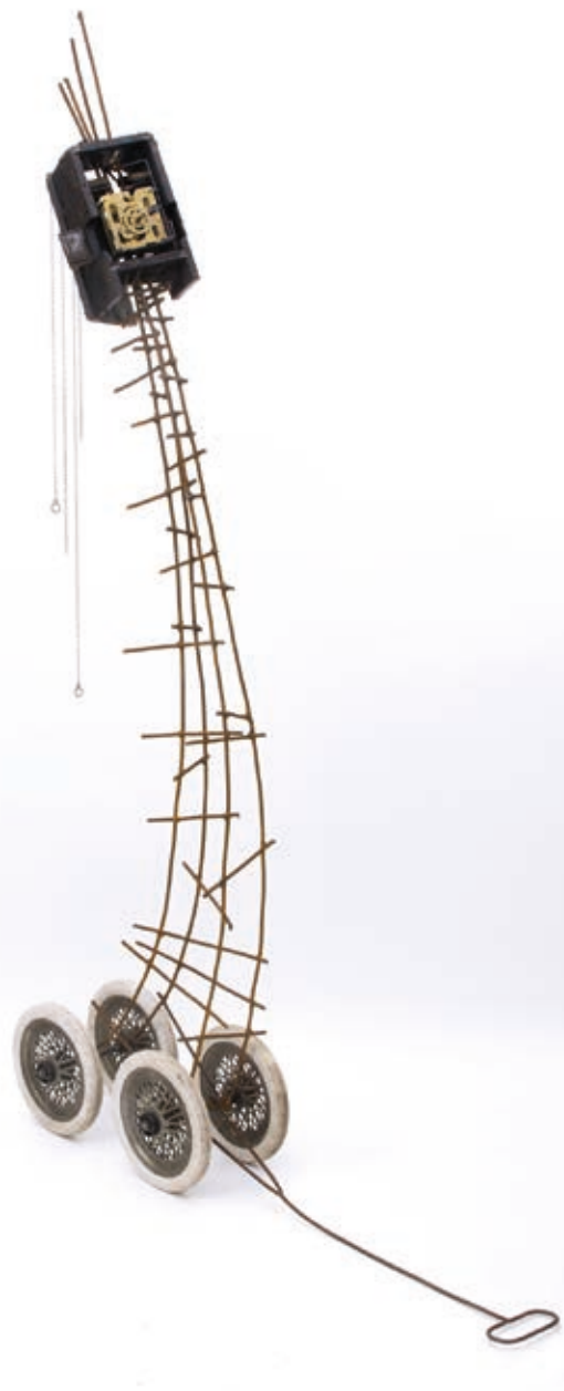
Ifj. SZILÁVCIS LÁSZLÓ: Száguldás , 2018, vas, fa, óraszerkezet, vegyes technika, 176x50x20 cm

Szobraiban és assemblage-technikával készült műveiben szintén ezeket a tartalmakat sűríti egybe a művész, aki a magyar lemezzobrászat elindítói közé tartozott. Lemezből készült műveiből huszonnégy darab látható a kiállításon. Szobrai közül a legszemélyesebb élményt hordozó mű a Búcsú címet viseli. Műve felesége halála után, az elválás pillanatának fájdalomából fakadt-szakadt ki. Szobra két ember akaratlan, az elmúlás kényszerítette elválásáról szól. Mindez két kavicsban és egy darab vasban ölt testet. A hatalmas