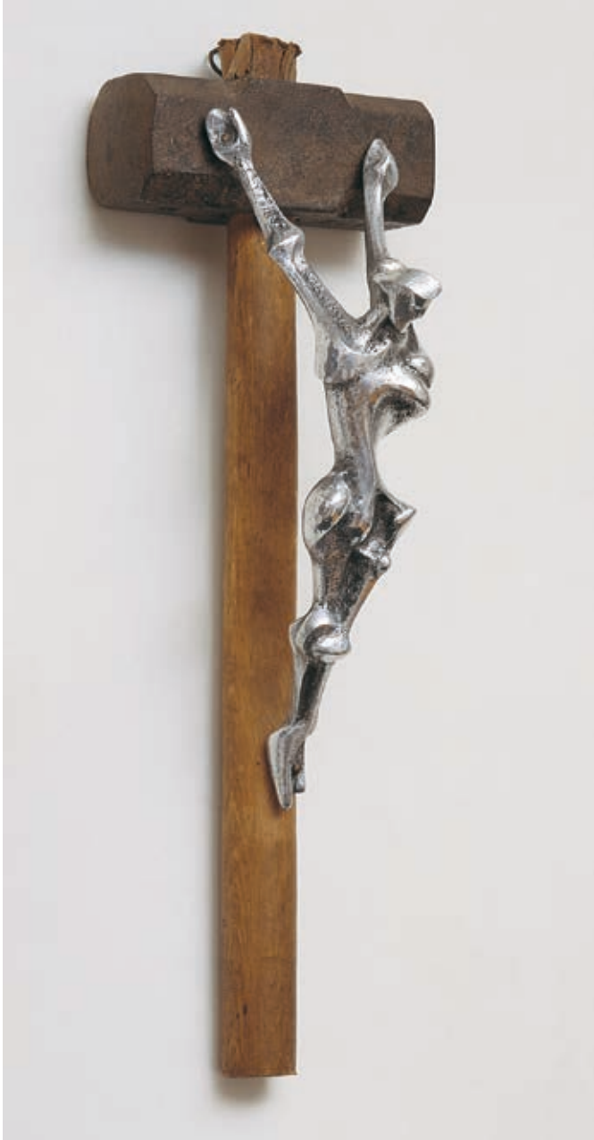
Id. SZILÁVCIS LÁSZLÓ: Apai örökség , 1964, öntött alumínium, 54 cm

virágok, melyek pipacsok is lehetnének, véresre festik a megművelt földet. Megállt az idő. Beállt az emlékezet állandósága. A metafizikus-szürreális állandóság, melyben a cselekmény soha nem ér véget és soha nem változik, van, lesz, és volt. A vér pedig soha nem fog megszáradni, a mindenkori Ábel vére ez. Az ítélet elmaradt, de mementónak itt a véres, szakadt bakancs.