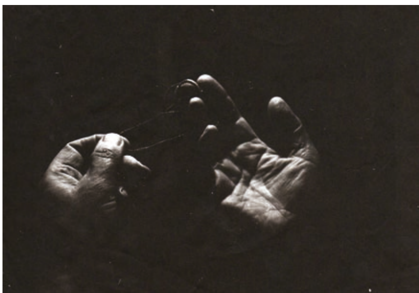
SZABADOS ÁRPÁD: Kezek , 1976–77, zselatinos ezüstbromid, dokubróm papíron, 13,6×19,4 cm, magántulajdon, A MissionArt Galéria hozzájárulásával, HUNGART ©2020