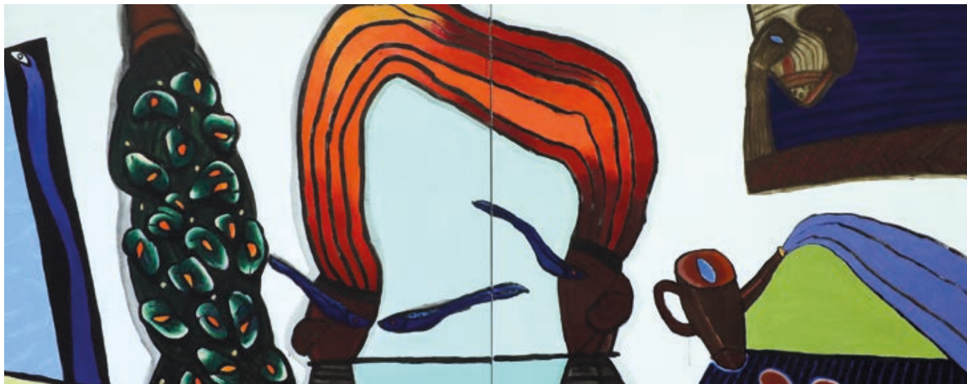
SZABADOS ÁRPÁD: Új kifestőkönyv I-II. , 2005, akril, olaj, vászon, egyenként 140×180 cm, HUNGART © 2020

kompozíció több tucat négyzetbe foglalt fejet látunk, ha nem a körüton lennénk, akkor még egy panelházra is asszociálhatnánk, amelynek ablakaiból egyszerre kukucsálnak ki a lakók. A bemutatott mű párdarabján ( A József körút 67. tárgyai , 1974) a négyzetekben, néha téglalapokban viszont rengeteg tárgy – könyv, kés, kötél, kabát stb. – sorjázik. Ugyanerre az elvre épülnek a korpuszokat megjelenítő Profánia II. (1974) vagy Tojás című (1975) ceruzarajzok is. Ez utóbbi lapnak szimbolikus jelentése is van, a tojás ugyanis a születés, az élet, továbbá a kemény héj által védett, a kezdetektől eltervezett teljesség jelképe. A gyermekrajzokból és falfirkákból merítő kifejezőmódjával Szabados természetesen nem volt egyedül a magyar művészetben. Kortársai közül elég most csak Ujházi Péternek az 1970-es évek közepén született festményeire és rajzaira, illetve a valamivel később pályára kerülő Wahorn Andrásnak graffitikat idéző erotikus munkáira utalnom.