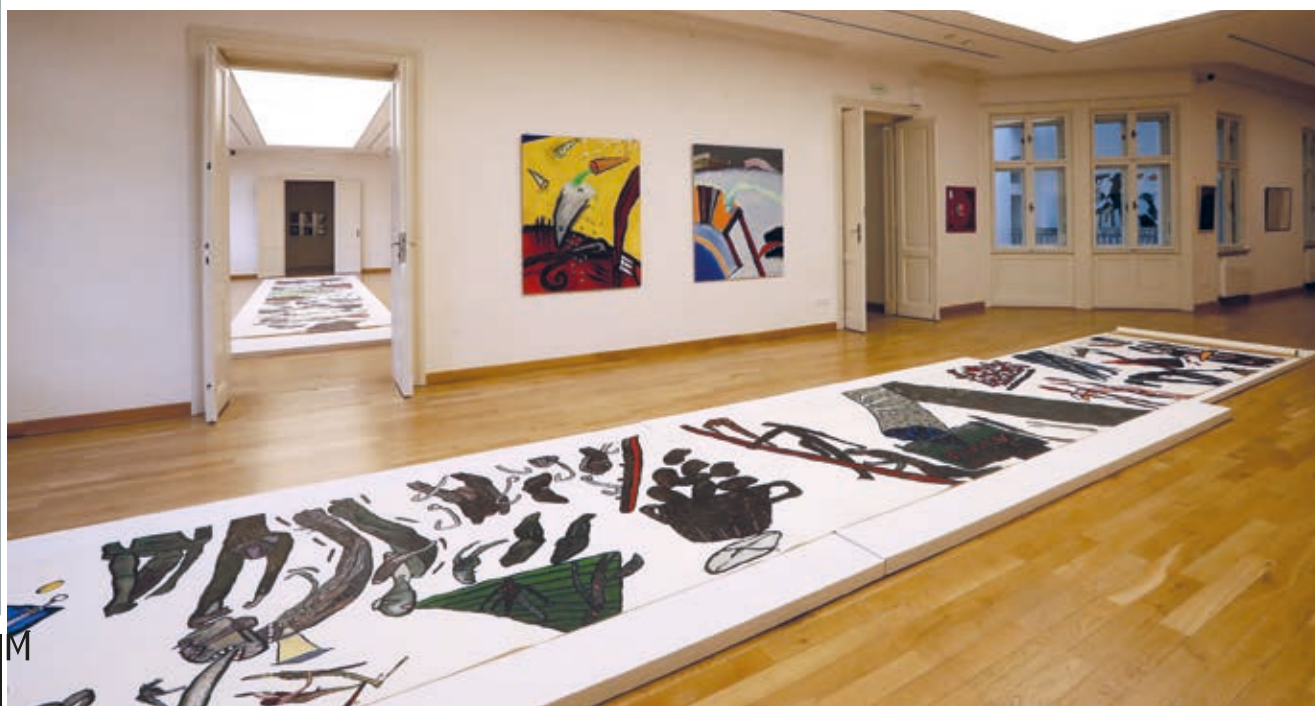
Kiállítási enteriőr

A nagy, színes, expresszív formákra épülő új hullám a 80-as évek elejétől terjed el Magyarországon, főleg a festők körében, de néhány grafikus is alkalmazta ezt a kifejezőmódot. Így Szabados is, akinek korai színes és expresszív ceruzarajzai mutatnak némi rokonságot a transzavantgárral; végső soron neki „csak” ezeknek a körvonalait kellett foltokká és vastag vonalakká