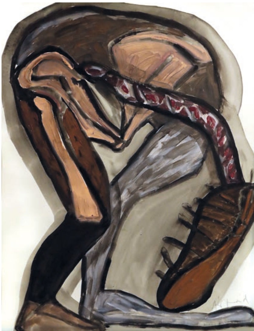
SZABADOS ÁRPÁD: Mumik , 1998–99, akril, papír, 50×65 cm, HUNGART ©2020

Szabados Árpád művészete az avantgárd és a figurális kifejezőmódok pólusai között helyezkedik el. Mindkét szemléletből kiemelte a neki megfelelő mozzanokat, egyénítette azokat, és új egységet alakított ki belőlük. Ugyanezt tette a kompozícióit annyira jellemző fragmentumokkal is, ahogy ezt önvallomásában kifejti: „Meggyőződésem, hogy képeim nem torzók, még csak nem is vigasztalanul magányos darabok halmazai, ellenkezőleg: az elemei az egész részei, melyek csak időlegesen váltak külön.” 3 A kiállítás meggyőzően bizonyítja, hogy Szabados Árpád közelmúltunk képzőművészetének meghatározó alakja volt: gazdag esztétikai élmények és izgalmas szellemi utazás részese lehet tehát az, aki ellátogat Szegedre a Reök-palotába.