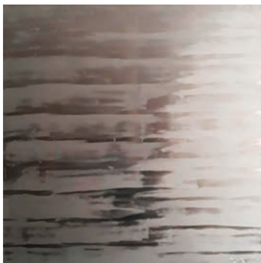
BONÉ RUDOLF: Csend , 2009, kinetikus hologram, alumíniumlemez, 100×100 cm, HUNGART ©2020

mi több, egymásra vonatkoztatásáról. De ha szerényebb vagyok, akkor sem állíthatok kevesebbet, mint hogy olyan gyűjteményről van szó, melyben a kismester korrekt alkotása otthonosan érezheti magát a világsztár produkciója mellett, és olyan gyűjtőről, aki egyaránt lényegesnek tartja a helyi, egy szűkebb közösség által fontosnak ítélt értékek megbecsülését és a nemzetközi, a határok által nem korlátozott törekvések támogatását.