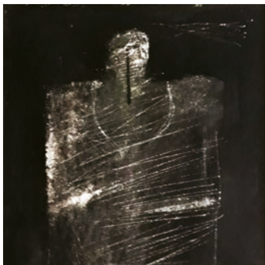
DAN PERJOVSCHI: Alak , 1987–88, rajz, tuskarcolat, grafitceruza, papír, 14,7×14,7 cm, HUNGART ©2020

Ugyan nem lehet kihagyni a szinte tálcán kínálkozó s a cím által is sugallt összevetést a francia főváros és az alliteráló Pece-parti partiumi település között, de ebben az esetben jóval többről, jóval izgalmasabbról van szó. Amennyiben hangzatosabban fogalmazunk: lokális, regionális értékek és globális, Kuala Lumpurtól Reykjavíkgig egyaránt érvényesnek tekinthető tendenciák, alkotói magatartások egymás mellett kezeléséről,