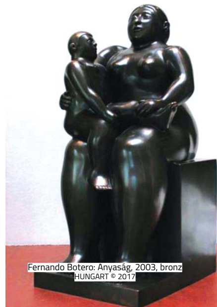
Fernando Botero: Anyaság , 2003, bronz HUNGART © 2017

A Galerie Bartoux egyik alkalmazottja záraskor vette észre, hogy Fernando Botero Anyaság című bronzszobra hiányzik. A több mint 400 ezer euróra becsült, 15 kilós szobrot nem védte semmilyen riasztórendszer, a galéria alkalmazottjai csak a biztonsági felvétel megnézése után lehettek biztosak abban, hogy lopás történt. A kolumbiai művész Ádám és Éva című alkotása 2014-ben New Yorkban két és félmillió dollárért kelt el.