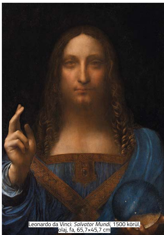
Leonardo da Vinci: Salvator Mundi , 1500 körül, olaj, fa, 65,7x45,7 cm

A Christie's New York-i árverésén Leonardo da Vinci egyetlen, még magánkézben lévő festménye, a Salvator Mundi című kép minden váraozást túlszárnyalva, mintegy 450,3 millió dollárért, azaz közel 120 milliárd forintért kelt el. A képet Dmitrij Ribolovljev orosz multi-milliárdos bocsátotta árverésre, de az új tulajdonosáról még semmit nem tudni. Ez a mostani, több mint 450 millió dolláros összeg többszöröse annak a rekordnak, melyet 2015 tavaszán Picasso Algír nők című műve állított fel.