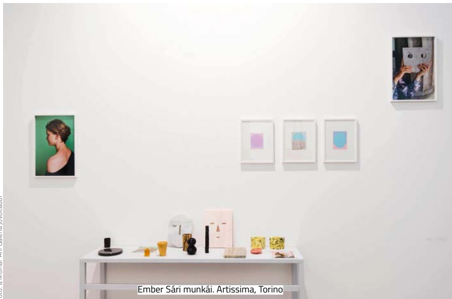
Ember Sári munkái. Artissima, Torino