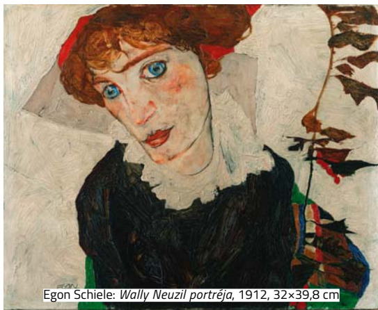
Egon Schiele: Wally Neuzil portréja , 1912, 32x39,8 cm