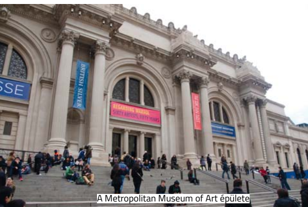
A Metropolitan Museum of Art épülete