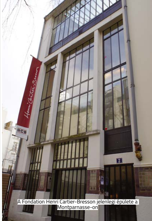
A Fondation Henri Cartier-Bresson jelenlegi épülete a Montparnasse-on