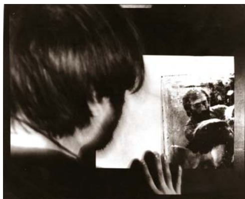
Az önreprodukció kísérlete (1981.)

Az egyik legérdekesebb tárlatot a Párizsban élő Agnes Rodier képeiből rendezték, amelyek budapesti fürdőket, illetve – Katarzyna Kozyrát messze megelőzve – meztelen női testeket ábrázoltak. E bemutató megszervezése újra csak rávilágít az akkori magyarországi, puhuló diktatúrás kulturális viszonyokra – külföldieknek akkoriban ugyanis csak előzetes minisztériumi engedély, államközi szerződés alapján lehetett kiállítást szervezni. Ilyen adminisztratív formáságokra azonban a szervezőknek sem kedve, sem energiája nem volt. Így egyszerűen megfordították a nevet: Agnes Rodier-ből Rodier Ágnes lett, s mivel a turpisság egyetlen elvtársnak sem tűnt fel, minden ment, mint a karikacsapás. Rehának ezúttal nem kellett okoskodnia.