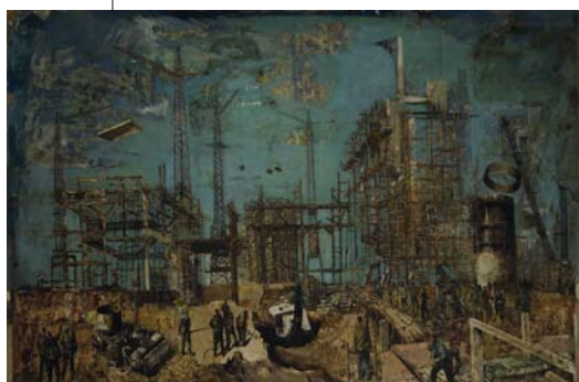
GYÉMÁNT LÁSZLÓ: Építkezés , 1965, olaj, farost, 93×140 cm

A Ploubuter Parkban a szél különféle hatásainak megfigyeléseire van lehetőségünk. A két párhuzamos kiállítás egyszerre, de ellentétes nézőpontból ír széljegyzeteket a jelenség mellé. A Paratusspiritus manuatum (Háztáji lélekeltetés) című kiállítás az OpenAir installációkról készült foto- és videoanyagból mutat be egy szűk válogatást, a kamarakiallításán látható festménysorozaton keresztül viszont átlépünk egy másik médiumba, és arra tehetünk kísérletet, hogy a festészet leghagyományosabb eszközeinek segítségével közelebb tudunk-e kerülni a szél természetének megértéséhez.