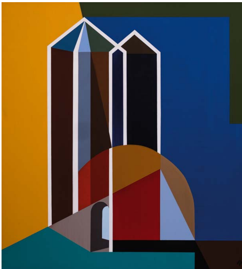
AKNAY JÁNOS: Emlék , 2016, akril, vászon, 100×90 cm

Egyszerre jelenik meg e műveken a felszabadultság, a belső derű, harmónia, s velük szemben a dráma, a feszültség. Akár a zenében, olykor igazán „örömzenének”