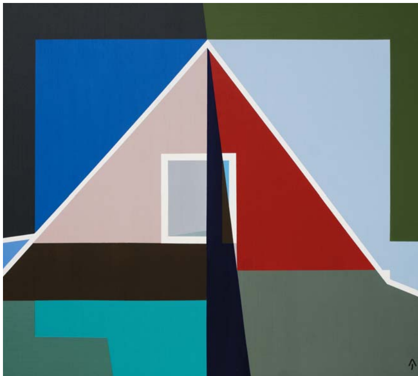
AKNAY JÁNOS: Emlék , 2017, akril, vászon, 90x100 cm

A kontraszt mellett éppen a deformáció, az elemek egy részének mikroszkopikus egységekre való tördelése a jellemző a 2014-es, 2015-ös év néhány festményére, illetve a fő, centrális helyen elhelyezett motívumoknak a korábbiaknál is erősebb tömörítése. Vannak olyan művek is a termésben, ahol a kétféle megoldás találkozik, s a hangsúlyosan megjelenő és részekre tördelt motívumok együtteséből egyféle labirintus bejárata rajzolódik ki. Az új utak, megoldások keresésének vagy az emlékezés új irányainak a jeleként? Aligha lehetne határozott választ adni erre a kérdésre, ahogyan azt is inkább csak megfigyelt, de egyelőre nem igazán értékelt jellemzőként említem, hogy ennek az időszaknak a kompozíciójában az architektúrális elemekre emlékeztető formák mellett egyre gyakrabban tűnik föl a kép egyik felső sarkában egy nagy négyszögletes mező,