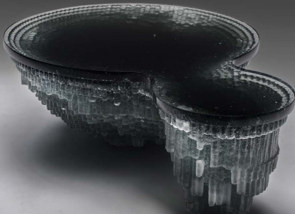
VARGA DÓRA: Smog spot , 2017, formába olvasztott, csiszolt, polírozott üveg HUNGART © 2017