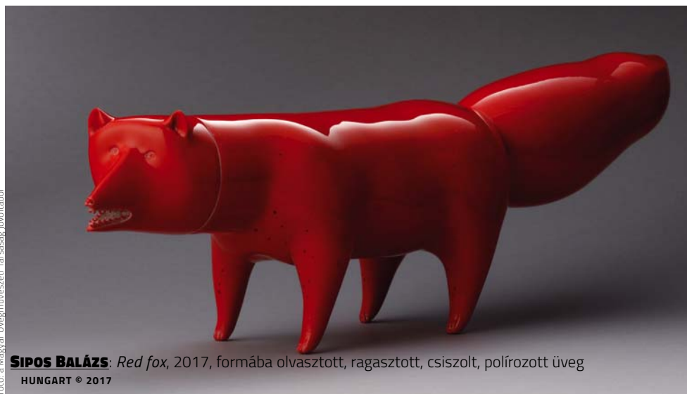
SIPÓS BALÁZS: Red fox , 2017, formába olvasztott, ragasztott, csiszolt, polírozott üveg HUNGART © 2017