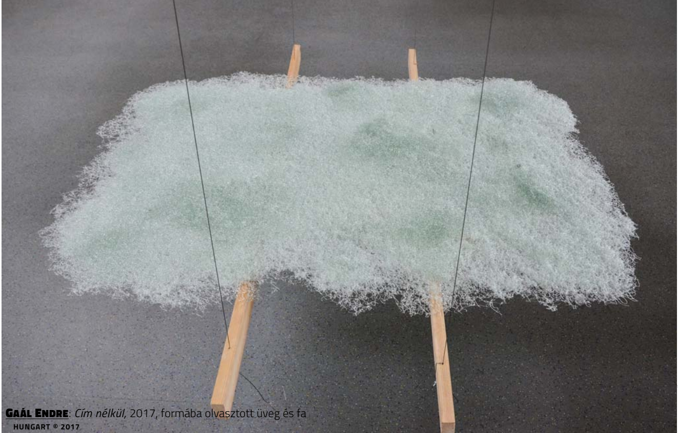
GAÁL ENDRE: Cím nélkül , 2017, formába olvasztott üveg és fa HUNGART © 2017