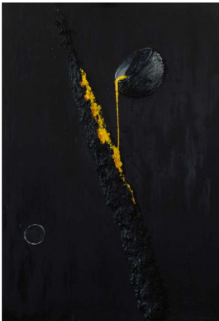
BAKSAI JÓZSEF: Hajnalcsillag , 2015, olaj, vászon, 150x100 cm

A 2008-ban alakult Matéria Művészeti Társaság veszprémi kiállításához írt bevezetőt kezdi a fenti Fülep Lajos-idézettel Gáll Ádám festőművész. Fülep gondolata esszenciája a Matéria anyag- és műalkotás-szemléletének. A társaság tizennégy művészének munkáiból áll össze az a „konstelláció”, ami a Csikász Galéria kiállításán együtt válik műalkotássá.