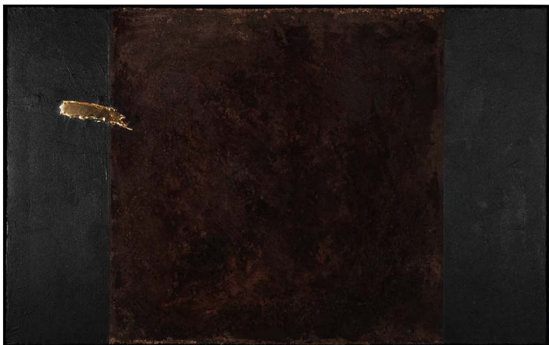
BÁTAI SÁNDOR: Princípiumok VI. (Földírás) , 2014, vegyes technika, papír, 50x70 cm