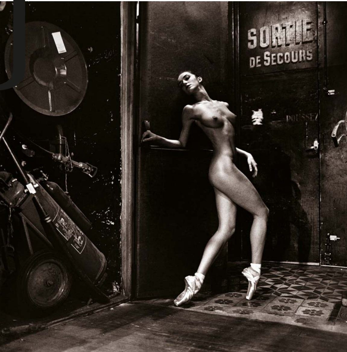
HELMUT NEWTON: Ballet de Monte Carlo , 1992

E kiállítási anyag töménységét a maga provokatív címlapjaival és az olykor a jó ízlés határait súroló, még a templomi ostyát is erotikával fűszerező fotóival feloldják Mario Testino termei, ahol a domináns férfitekintetet végre egy finom perspektívaváltás követi. A háromosztatú, hosszúkás tér szűkösnek tetszik a falakat teljesen beborító,