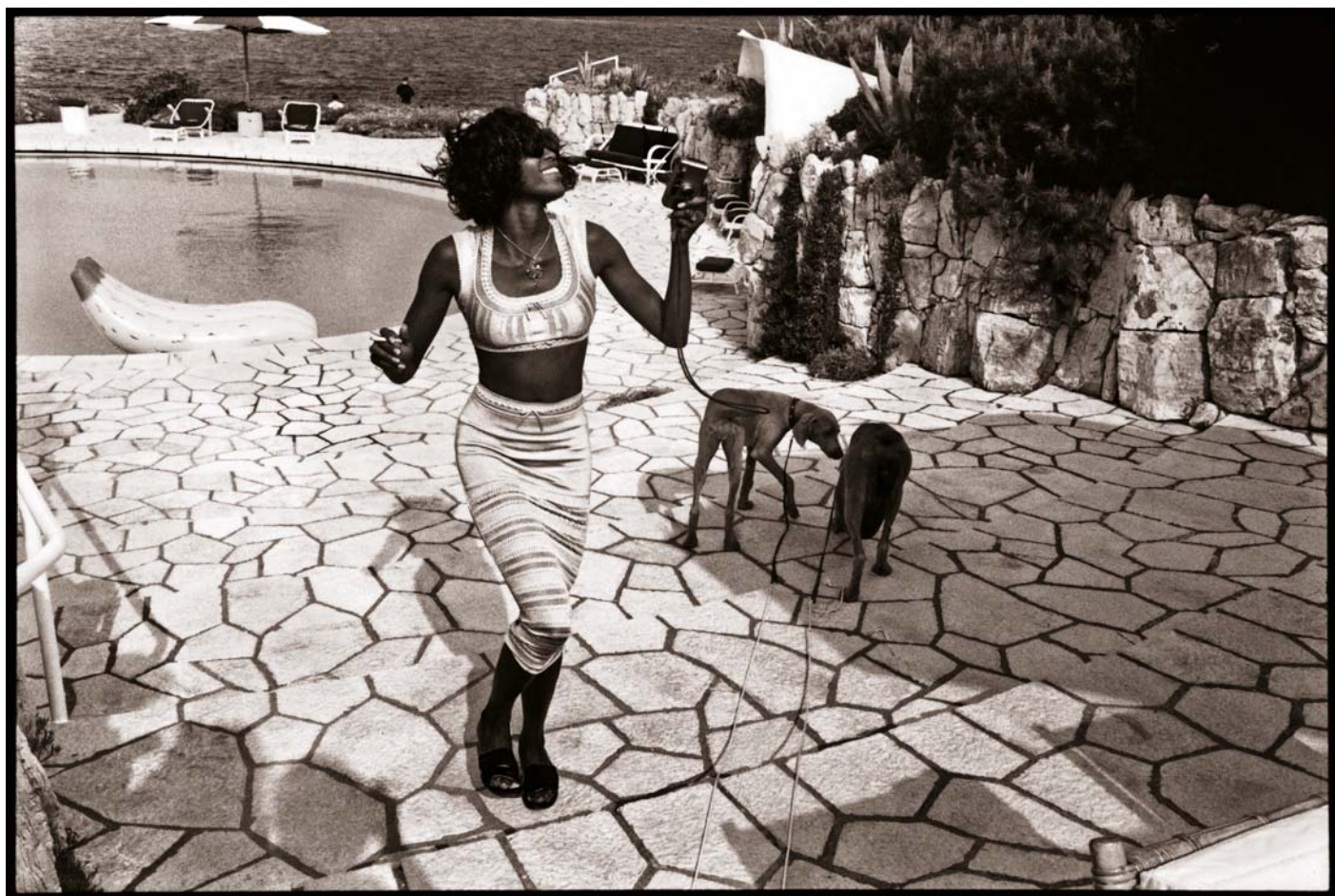
JEAN PIGOZZI: Naomi Campbell Mickkel és Bonóval , 1993, Antibes