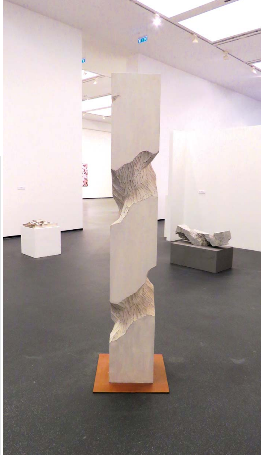
FARKAS ÁDÁM: Kibontott oszlop , 2015, festett diófa, 200×40×40 cm Jobbra: FARKAS ÁDÁM: Kozmikus hajlat , 2015, gránit, 40×30×100 cm

magabiztosságot, az óvást és a gyöngédséget, vagyis az eredetet, a kezdetet mutatja fel. A Fekvő harmadik (1970) változatában az alak torzóvá válik. Festett faszobra (1975) mintha M. C. Escher lehetetlen lépcsőit idézné fel, melyek nem tudni, hová vezetnek. Ez a szobor lehetne egy harmonika billentyűzete is, ahol hangot hordoznak a billentyűk, mélységet és magasságot. A Polírozott négyzet (1976) krómozott bronz a anyag változását, sokarcúságát, a durvaságtól a leheletnyi finomságig terjedő mivoltát, a sötétségtől az aranyló csillogásig tartó világot, a sebezhetőséget és a sérthetlenséget jeleníti meg. „Amikor faragok, hagyom, hogy beleszóljon a kő. Nagyon fontos a kő akaratát megérteni, és hagyni, hogy valamennyire irányítson. Nem szabad megerőszkolni a követ, mert akkor a végeredmény unalmas, sőt szálnalmas lesz” – fogalmaz a művész. A Négyzetre bontás III. (1979) krómozott bronzának domborulata is az összetartást, a belső tartást és nyugalmat idézi fel a nézőben. A Föld születése I. (1970) vörös márványa motívumában és színében is összhangban van Rákossy Anikó 2017-ben született alkotásaival.