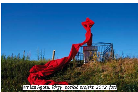
Krnács Agota: Tárgy=pozíció projekt , 2012, fotó