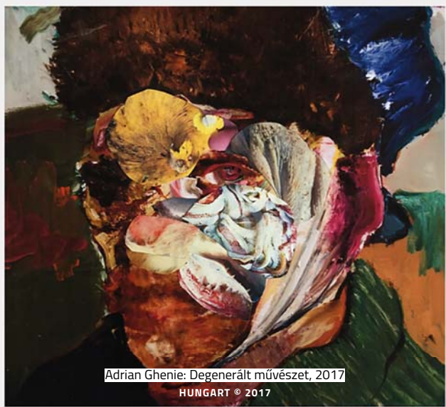
Adrian Ghenie: Degenerált művészet , 2017

Többek között Cindy Sherman és Glenn Ligon is adományozott műalkotásokat arra a kiállításra és aukcióra, amelyet különböző civil szervezetek rendeztek, hogy segítsék a Franciaországba érkező menekülteket. A kiállítás a párizsi Tokió Palotában látható majd szeptember 16–21. között. A műtárgyak értékesítését a Christie's aukciósház bonyolítja szeptember 27-én az Azzedine Alaïa galériában.