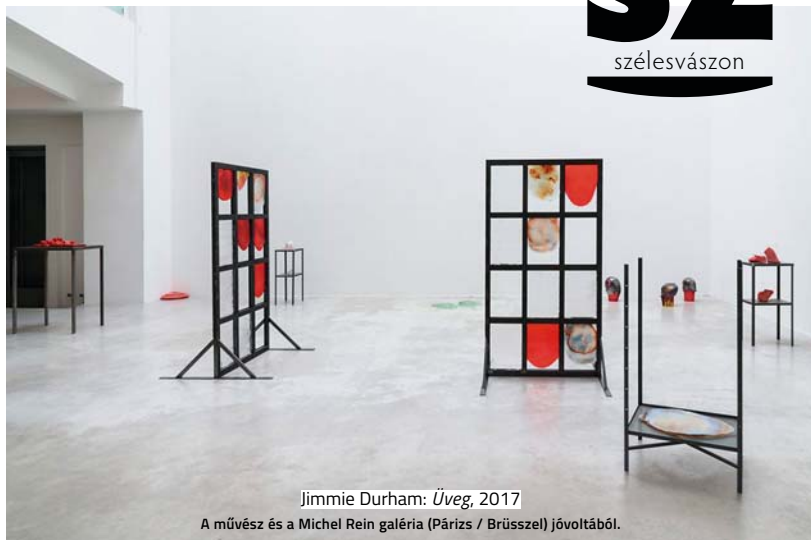
Jimmie Durham: Üveg , 2017

A művész és a Michel Rein galéria (Párizs / Brüsszel) jóvoltából.