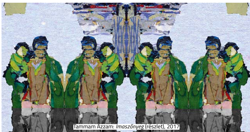
Izzam Azzam: Imaszőnyeg (részlet), 2017

Muszlim imaszőnyeget állítanak ki egy San Franciscóban megrendezett tárlaton neves művészek, többek között Mona Hatoum. A látogatóknak lehetőségük nyílik a 36 imaszőnyeget kipróbálni, melyet egy már nem működő kápolna padlóján helyeznek el. Az esemény idén ősszel veszi kezdetét a San Franciscó-i For-Site Alapítvány rendezésében. A szőnyegek között megtalálhatók pakisztáni mesterek kézzel szőtt munkái mellett 22 ország neves dizájnereinek darabjai is, például az amerikai Hank Willis Thomas szőnyege.