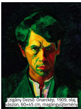
Czigány Dezső: Önarckép , 1909, olaj, vászon, 60x45 cm, magángyűjtemény

Szeptemberig látható tizenkilenc magyar avantgárd művész alkotása Amszterdamban a Zsidó Történelmi Múzeumban. A fauvizmustól a szürrealizmusig. Zsidó avantgárd művészek Magyarországról című kiállítás a 20. század első feléből mutat be műveket, abból az időszakból, amikor az országot a háború és az erősödő nacionalizmus egyaránt sújtotta. A kiállításra érkező legtöbb kép eddig még nem volt látható Hollandiában. A tárlaton Huszár Vilmos, Czöbel Béla, Moholy-Nagy László és Tihanyi Lajos munkái mellett többek között Berény Róbert remekművével, a Cilinderes önarcképpel is találkozhat a látogató.