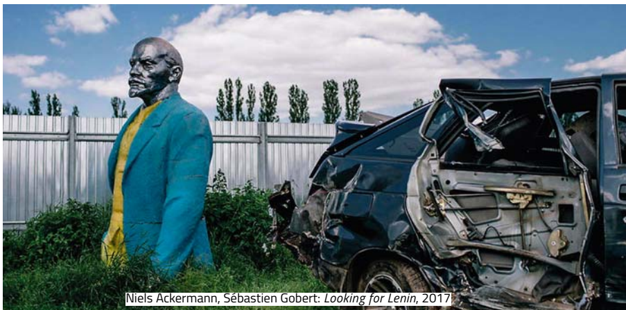
Niels Ackermann, Sébastien Gobert: Looking for Lenin , 2017

A dél-franciaországi Arles-ban idén nyáron látható fotókiállításon ( Les Rencontres d'Arles ) központi szerepet játszanak a politikai viszályok. A 48. alkalommal megrendezett eseményen 251 művész csaknem 30 kurátor közreműködésével mutatkozik be – többek között iráni és kolumbiai fotográfusok, akiknek testközelből találkoztak a háborúval. Több iráni művész témája az iszlám forradalom, amelyet 1979-től napjainkig követnek nyomon műveiken, míg a kolumbiai fotográfusok az ország ötven évvel ezelőtti polgárháborújára reflektálnak.