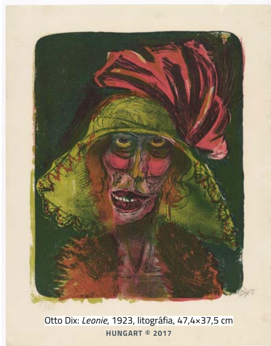
Otto Dix: Leonie , 1923, litográfia, 47,4×37,5 cm

Cornelius Gurlitt váratlan döntést hozott, amikor a náci korszakban felhalmozott, felbecsülhetetlen értékű műtárgyait örökségül adta a Kunstmuseum Bernnek, ezzel új lendületet adva a művek eredet-meghatározásának. A magányos remete, aki a vész-korszak idején összevásárolt műkincseit évtizedekig Münchenben és Salzburgban tartotta, 2014-ben, egy héttel a halála előtt hívta fel a múzeumot, hogy mint egyedüli kedvezményezett, a műtárgyakat felajánlja az intézménynek. Gurlitt hagyatéka több mint 1500 műkincset tartalmaz, többek közt Henri Matisse, Claude Monet és Otto Dix festményeit, amelyekből a múzeum 2017 őszén rendez bemutatót.