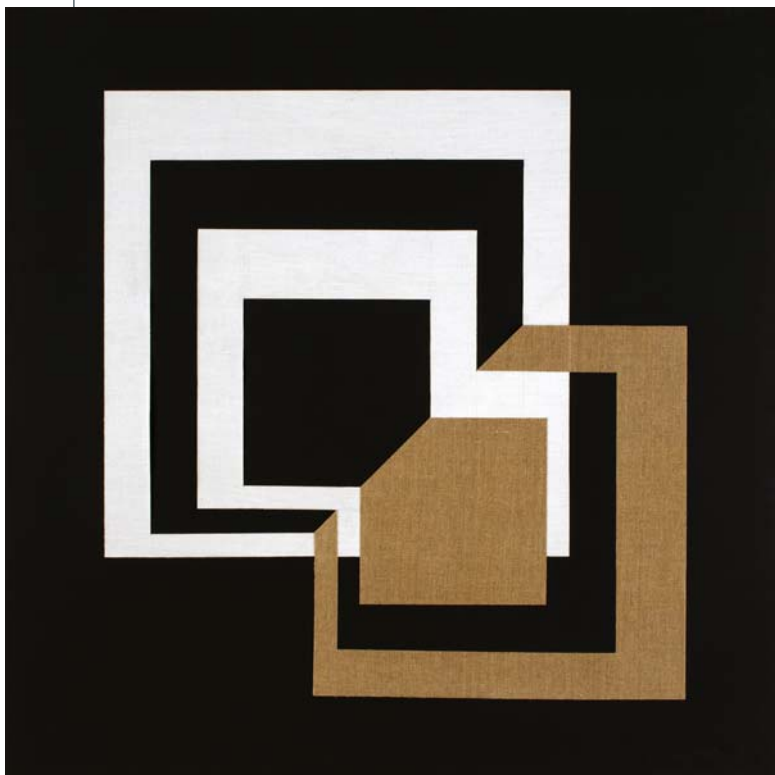
GÁBOR TIBOR: Hommage á Albers , 1975, akril, fatábla, 100x100 cm Az Elizabeth Dee Gallery (New York) és a Vintage Galéria (Budapest) jóvoltából. HUNGART © 2017

P. G.: A 2015-ös Bookmarks-kiállítást hiánypótlónak szántuk. Akkor már hosszú évek óta szedtünk össze műtárgyakat a korszakból, és hittünk benne, hogy ezek a művészek és művek el fogják érni azt, hogy méltó helyükre kerüljenek. A nemzetközi érdeklődés az első Bookmarks után már beindult, a Tate vásárolt is Bak Imrétől, az Art Cologne pedig meghívta a kiállítás egy kibővített verzióját. Minden ilyen esemény megdobja az érdeklődést, különösen, hogy a tengeren túl úgymond egy másik világ van, ahová nem igazán jutnak el az európai hírek. A nemzetközi érdeklődés egy korszak művei iránt nem egyik pillanatról a másikra alakul ki. A legfontosabb hozzáadéka a kiállításnak, hogy egy ilyen közegben, ennyi művész ilyen sok munkával bemutatkozhatott.