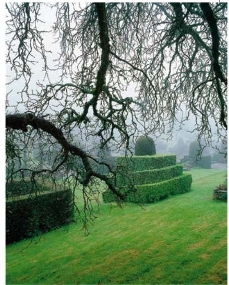
YANN MONEL: A kert meséje, részlet, kép- és hanginstalláció, ezüstmásolat-sorozat 31 kertről, 48x38 cm, HUNGART © 2017