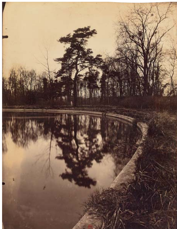
VUE DU PARC DE SCEAUX:

Alfred Sisley egy egész sorozatot festett a párizsi kerti kávézókról, és Manet is megfestett egy divatosan öltözött párt egy télikert intim környezetében. A „jardin potages”-t, a zöldségek kerteket és munkásnőit különösen Camille Pissarro szerette megörökíteni, és Monet első kerti képén, amely apja büszkesége volt Saint-Adresse-ben, már az akkor még olyan ritka növények is virítottak, mint a nagyra növő kerti gladiólusz vagy a muskátli. Monet nemcsak megfestette kertjeit, de mint író barátja megjegyezte, „megszállottan” kertészkedett is, és amikor megvette Givernyt, már nem volt megállás. „Állandóan a kertem lefestésén dolgozom, és nagy kedvvel, ehhez állandóan