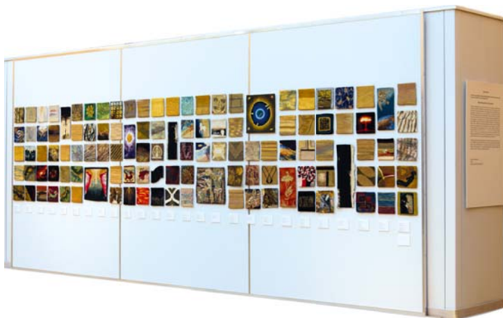
Részlet a kiállításból