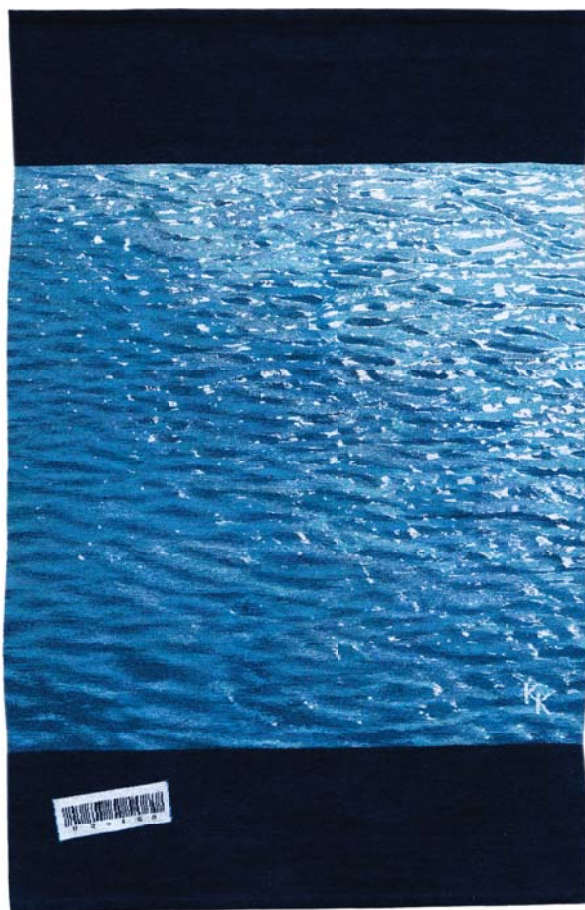
KISS KATALIN: Sorszámzott tájemlék, gyapjú, pamut, viszkóz, 175x115 cm