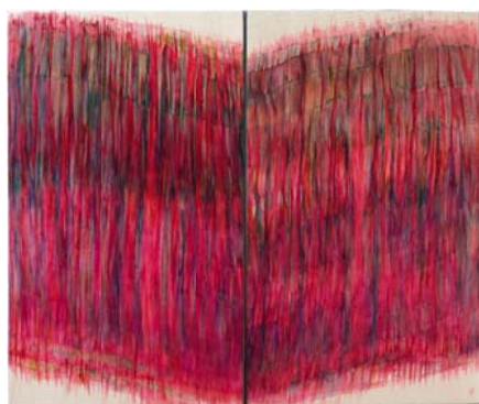
SOMODI ILDIKÓ: Apokalipszis – diptichon, pamut, 150x95 cm