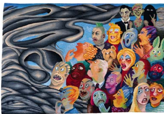
CHRISTINE SAWYER: Derült égből..., fésűs gyapjú, pamut, 200x140 cm