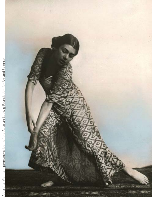
Albertina, Vienna – permanent loan of the Austrian Ludwig Foundation for Art and Science