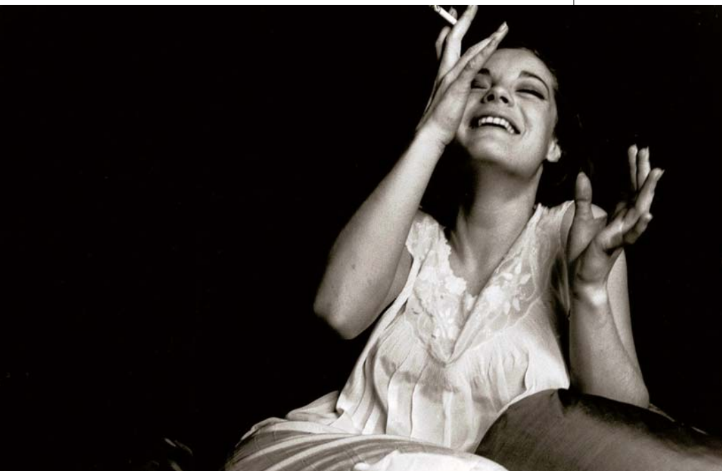
Albertina, Vienna © Will McBride Estate/Berlin

A fiatal női test kecses formáinak ábrázolása az izgató erotika világára nyitott széles ajtót, a korai aktfotók annyira népszerűvé váltak, hogy még szereő nézőképek és képsorozat-leporellók formájában is piacra kerültek. A fényképezés kezdetével gyakorlatilag egy időben született meg az alig leplezett, átlátszó ürüggyekkel álcázott vintage pornó. Léda a hatyúval, például. Minden változik, de az aktfotózás csábos műfaja napjainkig virul. Valószínűnek vélek egy fontos összefüggést: Albert Londe egyik sorozata lépcsőn lemenő