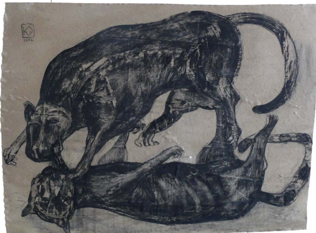
KIRÁLY GÁBOR: Ocelot II., 2012, akril, szén, papír, 100x100 cm Somogyi György gyűjteménye