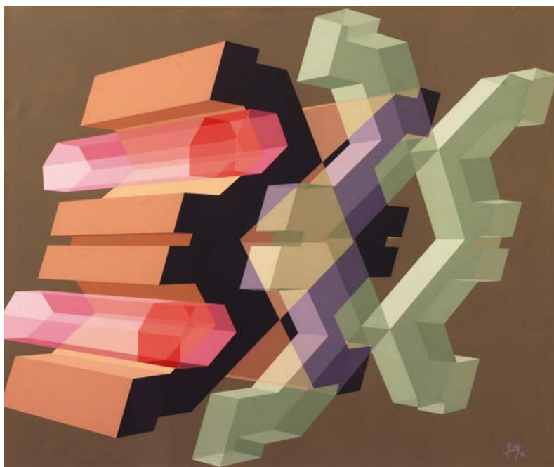
JOLÁTHY ATTILA: Etalon, 1994, akril, vászon, 100x120 cm

Januárban nyílt a váci Modern Művészeti Gyűjteményben Joláthy Attila (1927–1998) festőművész „életmű”-kiállítása, amely a nyár elejéig látogatható. A több száz műre rúgó hagyatékából körülbelül ötven alkotás – zömmel festmények és néhány térplasztika – került bemutatásra, a válogatás tehát jobb esetben is csak szűk retrospektív, de az alkotó munkásságának megismertetése, újrafelfedezése érdekében ez a kegyes csalás megengedhető.