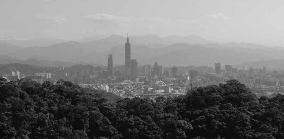
1. kép Tajpej látképe a környező hegyekkel Photo 1 A view of Taipei with the surrounding mountains Forrás/ Source: a szerző felvétele / photo of the author (2017)

Tajvan gazdasági szerkezetében fokozatos hangsúlyeltolódás ment végbe a munkaerő-intenzív ágazatok felől a high-tech iparágak irányába. Ez utóbbiak közül a világgazdaság szempontjából is a legfontosabb az elektronikai iparág volt. Tajvan kiváló eredményeket ért el a félvezetők, az optikai-elektronikai, információtechnológiai, távközlési és elektronikai területen. Napjainkban a tajvani gazdaság súlypontja a nanotechnológia, biotechnológia, optoelektronika és az idegenforgalmi szolgáltatások irányában látszik elmozdulni, ezek az ágazatok alapvetően a fővárosban, Tajpejben és vonzáskörzetében koncentrálódnak (1-2. kép).