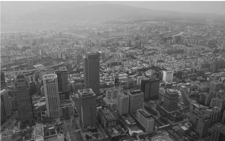
2. kép Tajpej látképe madártávlatból, a Tajpej 101 (101 emeletes) épületből Photo 2 Bird eye view of Taipei (from 101 Building)