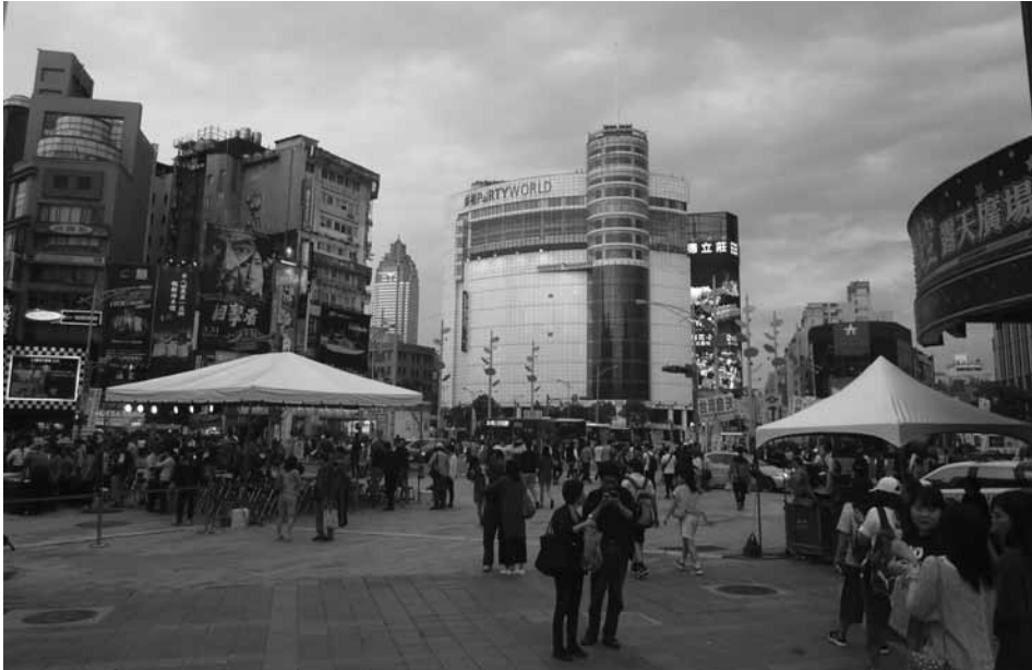
3. kép Tajpei belvárosi utcarészlet

ve 519 milliárd USD), mind vásárlóerő-paritáson (PPP) számítva (1.125 milliárd USD). Az utóbbi tekintetében 2020-ban is várhatóan megtartja ugyanezt a pozíciót, míg a folyó áron számított GDP esetében előreláthatóan a 22. helyre kerül. Tajvan gazdasága – folyó áron – nagyságrendileg Argentínához vagy Svédországhoz hasonlítható, míg PPP bázison az ausztrál, vagy a lengyel gazdasághoz hasonló (3. kép).