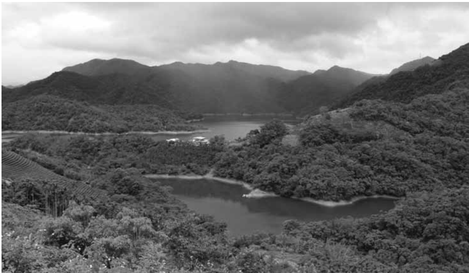
4. kép Víz tározó Tajpei közelében – New Taipei City, Shiding (Ezer sziget tava) Photo 4 Water reservoir in New Taipei City, Shiding (Thousand Island Lake)

E folyamatot három tényező okozza, illetve erősíti: az egyik, hogy a mezőgazdasági munka fizikai munkai igényessége nem vonzó számukra, másrészt a fiatalok nagy része tovább tanul (közülük nem kevesen külföldön) és utána szintén más szakmában helyezkedik el, végül a városi és a vidéki háztartások közti jövedelmi különbségek csökkentik a helyben mara-