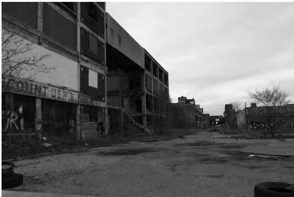
1. kép A Packard autógyár 1958-ban bezárt üzeme. Photo 1 The Packard Plant, closed in 1958.

Az 1950-es években az egyesült államokbeli munkahelyek 1/6-a kapcsolódott az autógyártáshoz. Ebben az időszakban érte el Detroit a népesedési csúcspontot is, több mint 1,8 millió lakosa volt (1. ábra). Az autógyártási ágazatban jelentős koncentráció ment végbe, a három nagy detroiti cég felvásárolta a vetélytársakat, illetve sok kisebb gyártó tönkrement, és bezárni kényszerült (1. kép) (SUGRUE, T. 2004). Az egyre terjedő automatizálás csökkenő munkaigénnyel és leépítésekkel járt, megindult tehát az ipari foglalkoztatás csökkenése, a munkanélküliség növekedése.