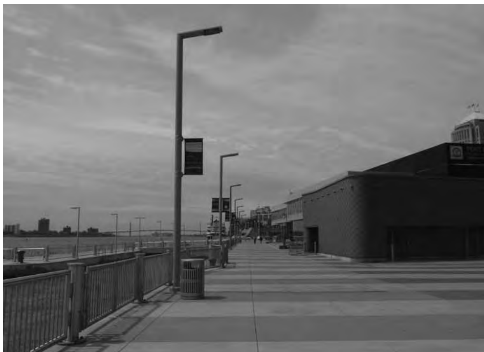
4. kép Felújított vízparti sétány a Detroit folyó mentén. Photo 4 Renovated waterfront promenade along Detroit river.

A biztonságérzet növelése érdekében a városvezetés növelte a rendőri jelenlétet, a bűnelkövetőkkel és deviánsnak tartott viselkedéssel szembeni zéró toleranciát jelentő „betört ablak” elvet alkalmazva. Ezt számos bírálóat éri, mivel a tapasztalatok szerint mindössze tüneti kezelést jelent a problémákra. A radikális baloldali kritikák szerint ez a stratégia azt a célt szolgálja, hogy féken tartsa a strukturális okból a munkaerőpiacról kiszorult tömegeket, hogy azok ne veszélyeztessék a profittermelési lehetőségeket (JAY, M. – CONKLIN, P. 2017).