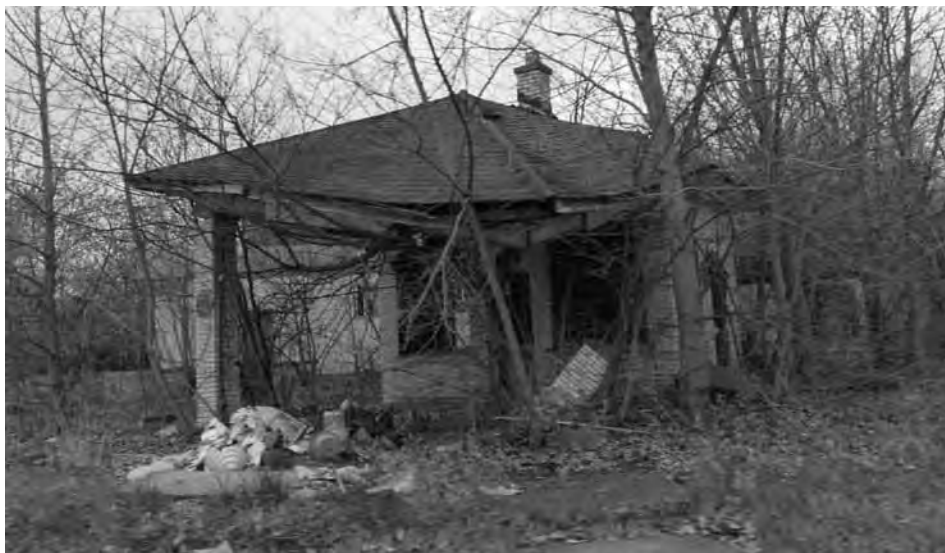
3. kép Elhagyott lakóépület Detroitban. Picture 3 Abandoned property in Detroit.