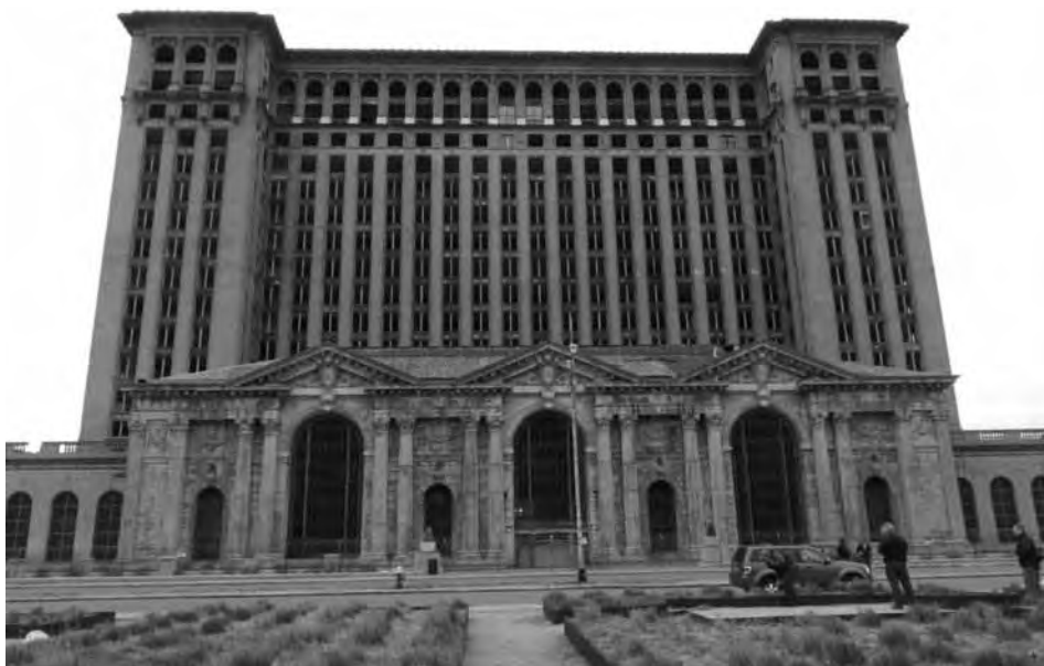
2. kép A bezárt Michigan Central Station. Picture 2 The former Michigan Central Station.

A válság széles körben ismert jelképévé vált a 1988-ban bezárt, korábban az egyik legfontosabb közlekedési csomópontnak számító Michigan Central Station (2. kép), de egyéb szimbolikus jelentőségű események is történtek, mint például a Motown lemeztársaság Los Angelesbe költözése 1972-ben, ami a város kulturális szerepkörének a hanyatlását jelképezte.