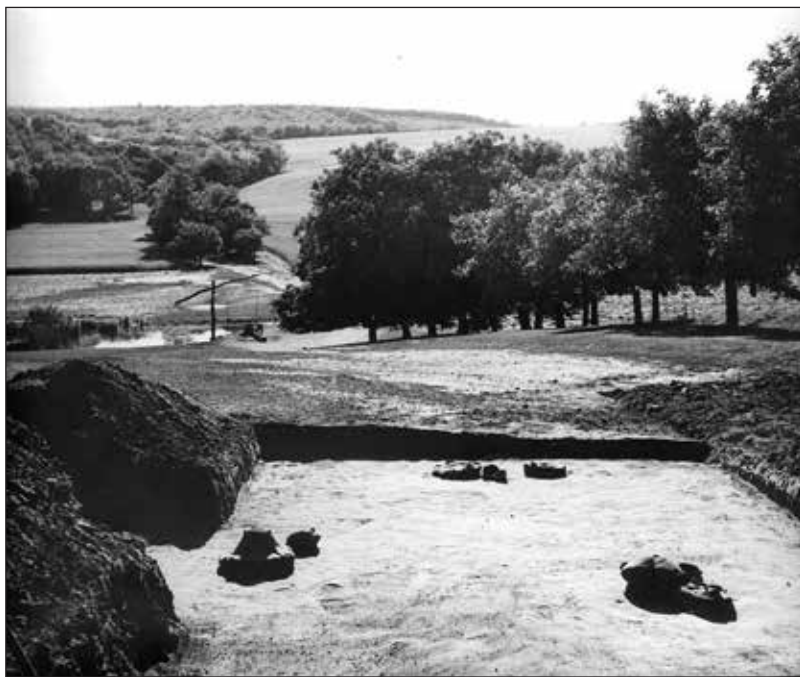
A középréppusztai feltárás, vaskori urnasírok

írásos része nem maradt fenn, rendelkezünk viszont sok jó minőségű ásatási fotóval. Vannak továbbá eredeti feljegyzések és fotók a kerámia restaurálásáról. 11 Közbevetőleg megjegyzem, hogy a múzeum 1933-ban új fényképezőgépet szerzett, nyilván Nagy László kezdeményezte a beszerzést. Ez a feltárás is jól ismert a nemzetközi régészeti szakirodalomban. Az 1937. évről készült jelentés szerint folyamatosan figyelemmel kísérték a Szent László-templom környékén a Viadukt építési munkáit, XVI–XVIII. századi férfi és női viseleti emlékeket, ékszereket találtak. Jelentős munka folyt 1938 elején, mégpedig Veszprém egyik fontos lelőhelyén, a veszprémvölgyi kolostor területén a város megbízásából, írségmunkások bevonásával. A cél az apácakolostor kiterjedésének meghatározása volt. Ismert, hogy a XI. század elején alapított kolostorba a XIII. században ciszterci apácák költöztek, majd a XVIII. században jezsuita templom épült a középkori helyén. Nagy László a kolostor legutolsó, XV. századi épületének részletét tárta fel, egy szabálytalan négyzet alakú udvart és körülötte néhány helyiséget. A feltárás közöletlen.