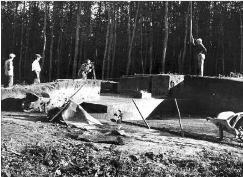
A farkasgyepői bronzkori halom feltárása

Amikor azt látjuk, hogy feltárásai közül csak a középrépáspusztai temető feldolgozása jelent meg aktív éve alatt, akkor figyelembe kell venni, hogy egyszerre több szakterületen dolgozott, és mindegyikben eredményesen. Sokoldalú képzettségén és jó előtanulmányain túl a kor színvonalánál jobb módszereinek kialakításában segítségére volt nyelvtudása, szakirodalmi olvasottsága, külföldi tanulmányútjai. Olvasottságára példa egy 1936-ból való felszólítás, melyben visszakérlik tőle G. Childe Danube in Prehistory című művét, 23 ami arra utal, hogy az 1928-ban megjelent, és akkor nagyon újszerűnek számító könyvet ismerte és olvasta, ráadásul a korban szokatlan módon angolul. Akkoriban a német volt a régészet szaknyelve, angolul kevesen olvastak.