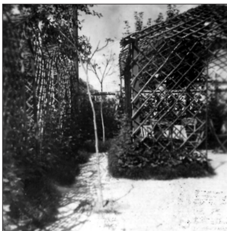
A Marosvölgyi vendéglő kerthelyisége