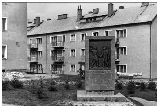
A Püspökmajor területén épült két kétemeletes lakóház