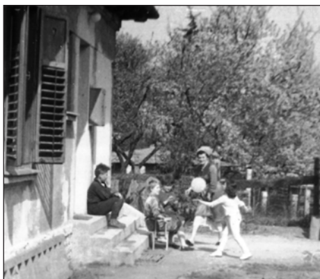
Esti előadásra készülnek a gyerekek