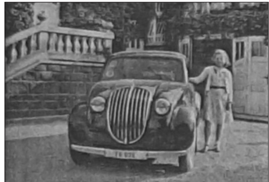
Marföldy Olívia a villa udvarán a család Steyer Puch autója mellett 36