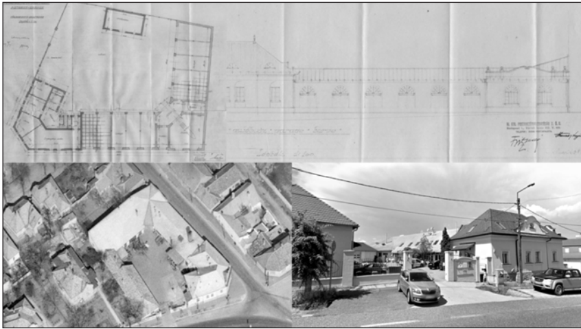
A MÁVAUT autóbusz garázs tervrajza, korábbi légi fotó és kép az épület mai állapotáról