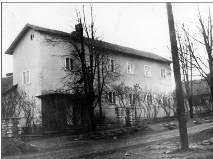
A Dohány utca 6/a-b alatti épület az 1960-as, '70-es években