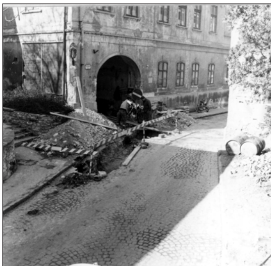
A Simoga-ház kapualjának bejárata a sírok előkerülésekor.

A templom helyét egyértelműen eddig nem tudta meghatározni a kutatás, mely köszönhető egyrészt a nagymértékű átalakításnak, másrészt a teljes pusztulásnak. Kralovánszky Alán szerint a templom helye a külső vár délnyugati részére tehető. 12 E délnyugati rész topográfiája ma is nagyon elkülöníthető a várnegyed egyutcás barokk képétől. 13 A kis területen található lakóépületek szabálytalan elrendezése archaikus formát mutat, habár láthatóan barokk és klasszicista külsővel rendelkeznek. A középkorban a mai bástya még nem létezett, így ez a terület jóval kisebb volt, egy átlós fallal volt lezárva, előtte valószínű töltés haladt.