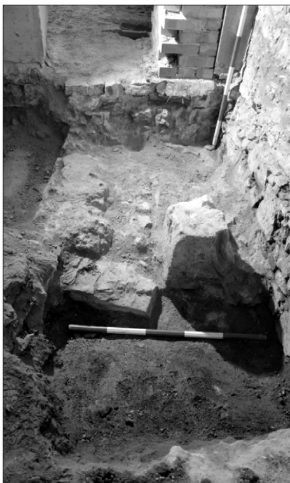
Kora újkori épület maradványa in situ XIII. századi faragvánnyal a piarista rendház épületében.

Ő ez alapján feltételezett egy XIII. századi építőtűhelyt Veszprémben. A többi darabját e nyílásnak a székesegyházhoz szokás kötni, de mivel a külső vár területén is előkerült egy ilyen darab, nem vethetjük el a kisrépostsághoz való kötését sem e faragványnak.