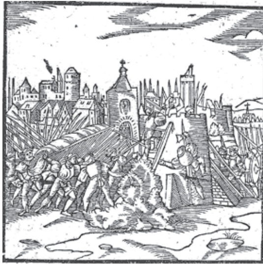
Veszprém elfoglalása egy korabeli metszeten. GEUFFROY 1568. CXCH.

A történetek alapján úgy látszik, nem sikerült megegyezni, s György visszatért a mezei hadakhoz. Ugyanakkor a Palotán hagyott unokatestvére, Thury Márton a későbbiekben, 1568 és 1574 között hosszabb ideig viselte a veszprémi főkapitányi címet. 49