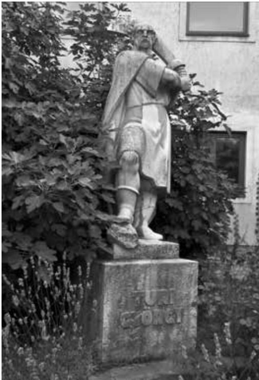
Ohmann Béla szobra Thury Györgyről Várpalotán.

küzdött. 3 Valószínűleg emiatt hamar búcsút vett Palotától, és 1556. március 7-től átvette a Léva várába rendelt királyi had főkapitányi, valamint a vár prefektusi tisztségét, amelyek mellé megkapta a provisor (udvarbírói) címet, valamint Bars vármegye főispánságát is. 4 E címek komoly elismerést hoztak számára. 5 Ugyanakkor itt is jelentős anyagi nehézségekkel kellett szembenéznie: a zsoldok kifizetése sokszor hónapokat késett. 6 Itt sem maradt azonban sokáig, ugyanis 1558. január 8-án a király Dobó Istvánnak adományozta Lévát. 7 Thury februárig töltötte be hivatalát, majd a várat elhagyva Podmaniczky Rafael és felesége, Lomniczay Johanna visszahívták Palotára. 8 Szeptember 8-án átvette Palota gazdasági irányítását, s ő lett a palotai vártartomány jövedelmeinek igazgatója. 9