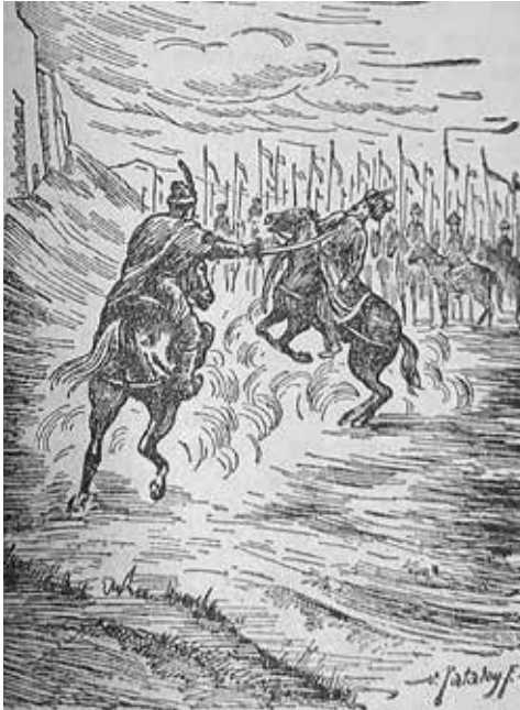
Pataky Ferenc grafikája Thury párviadaláról. T. THURY, 1941. 61.

meket, és többek közt Veszprém megyei birtokokat magának Thurynek, 18 vagy küldtek nagyobb összeget a zsoldok kifizetésére, 19 a helyzet vajmi keveset javult. 20 Kapitányként a palotához tartozó földeket nem csak a törököktől, hanem a magyar uraktól is meg kellett védenie, ugyanis például Magyar Bálint foglalt el több, a várhoz tartozó birtokot. 21 A nehézségek ellenére Thury megpróbálta a lehető legjobban ellátni feladatait, tataroztatta a várat és a védműveket, sőt a baj-