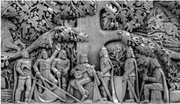
A Thury György halálát megéneklő lantos (részlet Wegroszta Zoltán alkotásából)

Mindezek alapján igazat adhatunk Paczoth Ferencnek, aki 1617-ben így méltatta a kapitányt: „Ezért, Thuri György, rendkívüli és egészen egyedülálló bátorságot, amelynek révén sok mindent ragyogóan véghezvittél, kiváltképp pedig megvédted a törököktől ostromlott Palotát, nem homályosítja el a feledés, nem törli el az idő.” 64