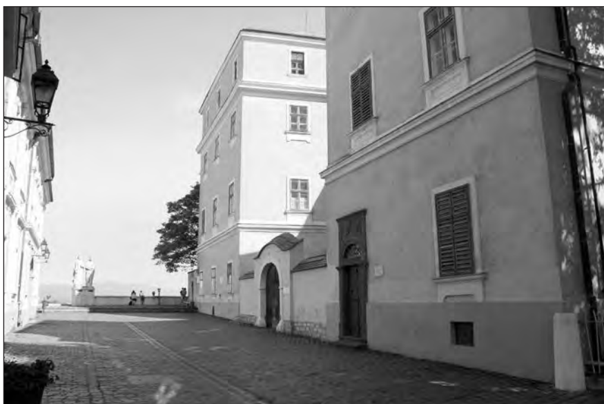
A Pannon Egyetem (volt) kampusza a Vár északi részén, amelynek helyén állhatott az az Árpád-kori épület, amelyben a székesegyházi iskola is működött.

A vár középkori topográfiája és más, közvetett utalások alapján Gutheil Jenő (is) azt feltételezte, hogy az iskola az egykori nagyszeminárium (ma a Pannon Egyetem által használt épület) helyén lehetett, vagyis a székesegyház és a Szent György-kápolna mögött, az északi várfokig terjedően. Ez a védett rész ad(hat)ott otthon az Árpád-korban valamennyi papnak, a diákoknak, ahol „ a püspök és kanonokjai, vagyis minden egyházi rendbeli papjai szerzetesi közösségben együtt éltek, s ahol az olvasó- és éneklőkanonokok oktatták a szentistváni időkben a szintén velük egy földél alatt élő papjelölteket ”. 15