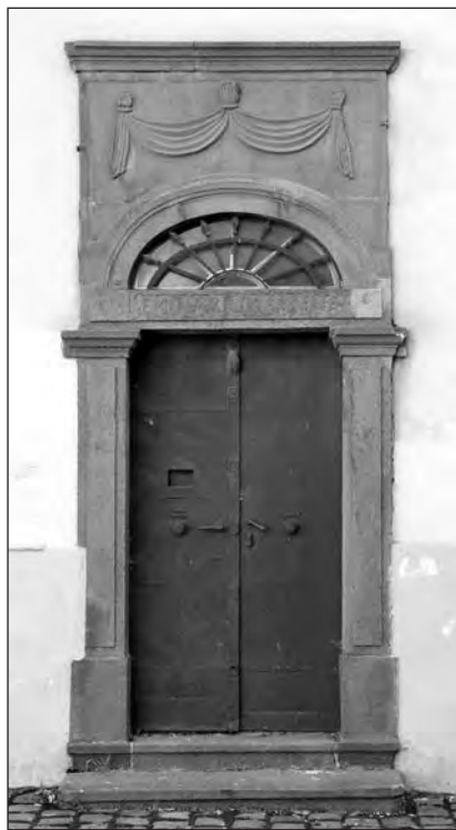
A nagyszeminárium bejárata. A felirata: SEMINARIUM S ANNAE [Seminárium S(anctae) Annae = Szent Anna szeminárium(a)]

A korabeli analógiák alapján feltételezzük, hogy ez nem csak a könyvek, az oklevelek őrzésére szolgált, hanem írószoba (scriptorium)