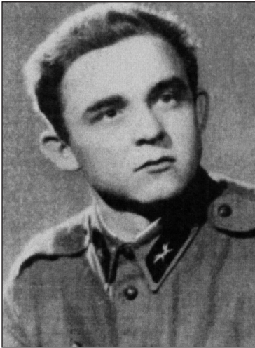
Csányi Ferenc honvéd (1934–1956) a szovjet megszállás első magyar áldozata 37