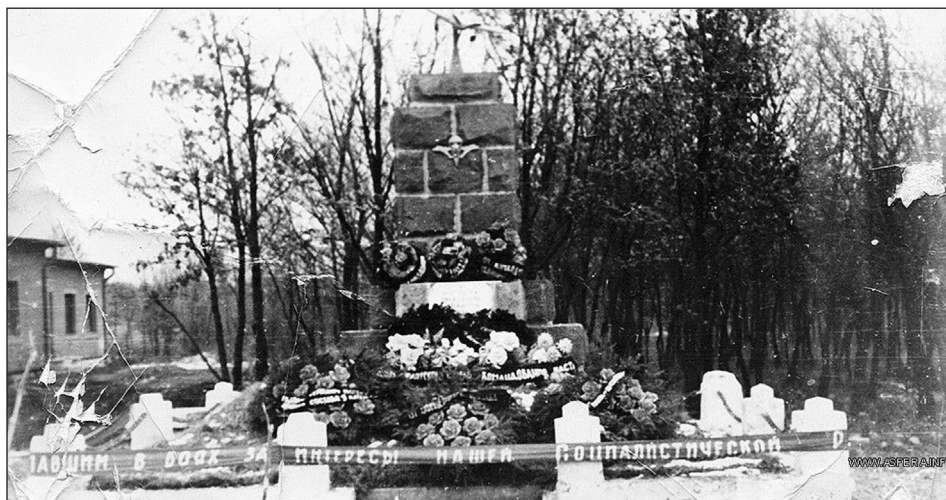
Az elesett szovjet deszantosok temetési helye, emlékműve. Szentkirályszabadja, repülőtéri városrés. A fotó 1957. november 7-én készült 54

Az Ady utcai (és a Mártírok úti) szovjet temetőben nyugvók földi maradványait később átszállították a Vámosi úti temető katonaparcellájába, a veszprémi repülőtéri városrészen eltemetettek sorsáról nem találtam hiteles információt. A veszprémi eseményekkel, a harcokban elesett szovjet katonákkal – mindenek előtt a 31. légedeszant gárdahadosztály emlékét őrző – internetes oldalakon olvasható: „2006-ban a