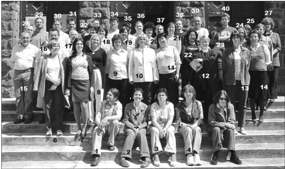
A Veszprém Megyei Múzeumi Igazgatóság munkatársai 2009-ben.