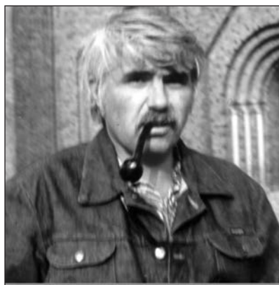
Dr. Törőcsik Zoltán régész, megyei múzeum-igazgató 1980–1987 között. LDM Fotónegatívár

meg Törőcsik Zoltán (Tiszavárkony, 1942 – Bakonyszentkirály, 2005) tanár, régész muzeológus igazgatóságának – 1980–1987 – évei alatt a felsőörsi raktárak kiépítése 1983-tól. 36 A Bakonyi Múzeum Erzsébet sétányi (akkor Lenin ligeti) épületében lévő, folyamatosan újabb és újabb helyiségek átalakításával nyert műtárgyraktárak ekkorra zsúfolásig megteltek, a gyűjtemények hozzáférhetetlenné váltak. Az alagsori restaurátor- és kiállításrendező-műhelyek is kis alapterületen, szerény felszereltséggel kaptak helyet. Az 1982-es évben mintegy 150 000 db egyedileg nyilvántar-