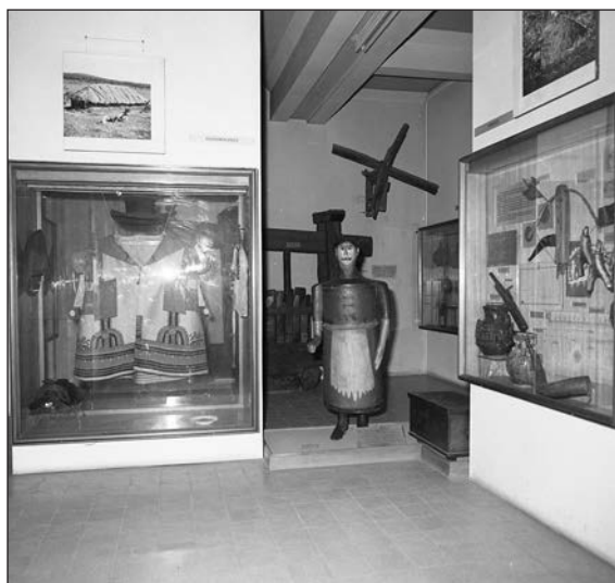
Az 1978-ban bezárt állandó kiállítás néprajzi része, 1974.

meg Törőcsik Zoltán (Tiszavárkony, 1942 – Bakonyszentkirály, 2005) tanár, régész muzeológus igazgatóságának – 1980–1987 – évei alatt a felsőörsi raktárak kiépítése 1983-tól. 36 A Bakonyi Múzeum Erzsébet sétányi (akkor Lenin ligeti) épületében lévő, folyamatosan újabb és újabb helyiségek átalakításával nyert műtárgyraktárak ekkorra zsúfolásig megteltek, a gyűjtemények hozzáférhetetlenné váltak. Az alagsori restaurátor- és kiállításrendező-műhelyek is kis alapterületen, szerény felszereltséggel kaptak helyet. Az 1982-es évben mintegy 150 000 db egyedileg nyilvántar-