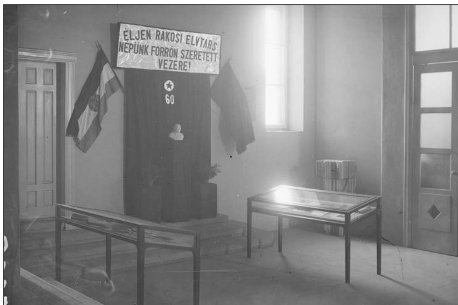
Rákosi Mátyás 60. születésnapja (1952. március 9.) alkalmából rendezett kiállítás a múzeumban.