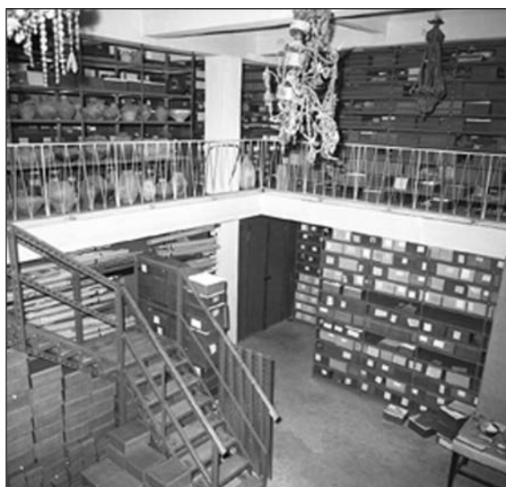
A Bakonyi Múzeum régészeti raktára 1974-ben.

töztek, azonban az ideális állapot ekkor még messze volt, hiszen az első időszakban a korábbiaknál is kisebb alapterületű, egyterű raktárhelyiség állt rendelkezésre. Egy komplex, sokoldalú tevékenységre lehetőséget biztosító, korszerű raktár-, restauráló- és kiállításrendezőközpont tervei azonban készen álltak. 39