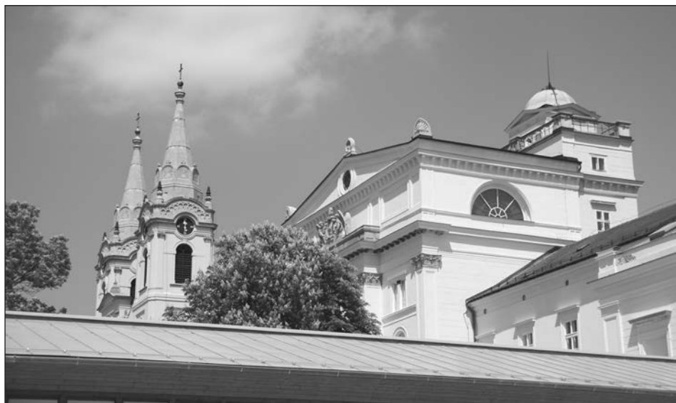
A zirci apátság látképe az arborétumból.