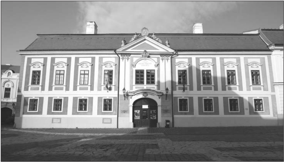
A veszprémi Dubniczay-ház homlokzata.