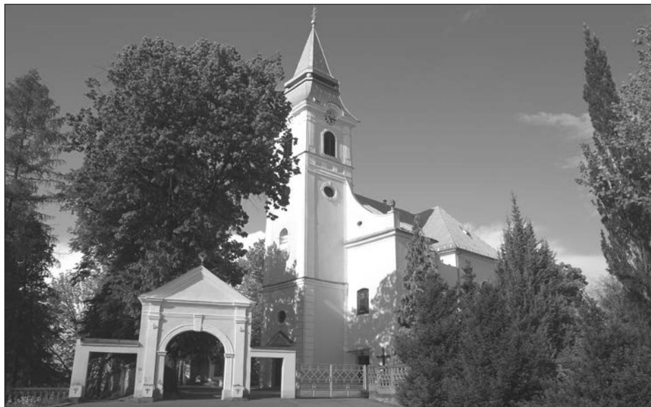
A máriatölgyesi Szent Jakab-templom.