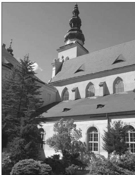
A heinrichauai apátság kvadruma.

A következő években Dubniczay István vagyonának nagy részét a ciszterci szerzeteseknek adta. Ebből is látszik, hogy nem novíciusként élt, mivel fogadalomtételle után is rendelkezhetett személyes vagyonnal. 1766. március 12-én még a hantai prépostság törzsokhegyi szőlőjét is a rendnek adományozta, mindössze évenként 6 forintnyi bért kötött ki magának jogelismerés címen. 81 A ciszterciek kötelékében eltöltött időből nem ismerünk olyan feljegyzéseket, amelyekből közelebről megismerkedhetnénk a prépost szerzetesi életével, a rend szabályainak megfelelően élte mindennapjait és tevékenyen részt vett Zirc második felvirágztatásában. A következő írásos nyoma a prépost cselekedeteinek a saját végrendelete, amelyet 1766. július 1-jén készítettett el zirci házában. 82 Testamentumának köszönhetően több értékes információt tudhatunk