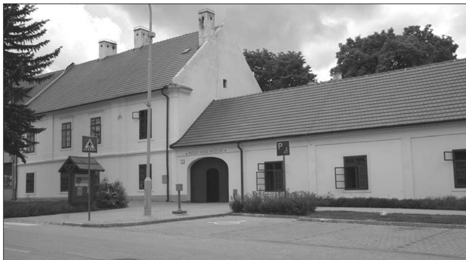
A zirci Dubniczay-ház.