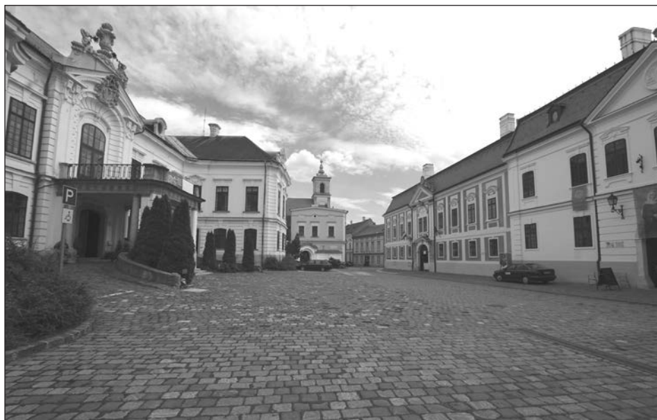
A Dubniczay-ház a veszprémi Várban.