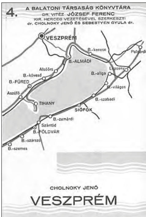
Cholnoky Jenő: Veszprém c. könyvének címlapja (forrás: szerző felvétele)

Megállapította a karsztosodás okát, menetét, a karsztformák (dolinák és víznyelők) különbségeit, a poljék típusait, a cseppkövek és travertinok keletkezését, a barlangok kialakulásának helyi okait és a kialakult barlangok jellemző típusait. A hazai karszt szakirodalomban a karsztról részletes átfogó képet adott. Munkásságának lényege, hogy az általa ismert irodalmi ismereteket, és egyéb információit átalakította saját tapasztalataival kiegészítve, rendszerré formálta. Írásaiból az átlagemberre ismeretei nagymértékben bővültek, sok ember figyelmét és érdeklődését keltette fel a karszt iránt. A későbbi karsztkutató generációk Cholnoky Jenő munkái után kaptak kedvet a karszt tudományos tanulmányozására. Sokat tett a barlangok turista szempontú népszerűsítéséért. Minden fórumon kiállt a karsztos természeti formák védelméért. Cholnoky munkásságának köszönhetően számos budai barlang menekült meg az örök pusztulástól (BALÁZS D. 1982, RYBÁR O. 2011c).