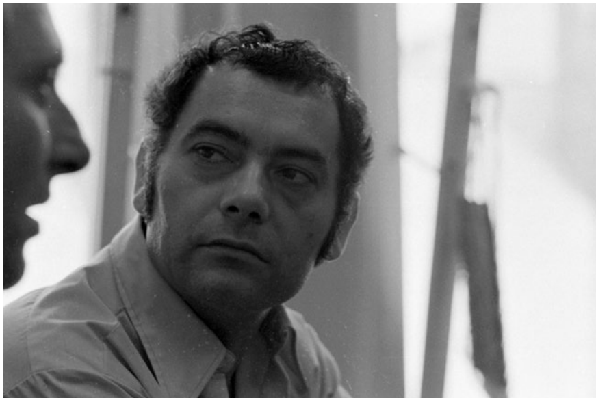
Csoóri Sándor Egy nomád értelmiségi című esszéjének sorsa sokatmondó esettanulmány az aczéli kultúrpolitikáról.

A Donáth Ferenc gondolata nyomán (az 1943-as szárszói konferencia mintájára szükség lenne egy értelmiségi találkozóra) megszülető monori találkozó ugyancsak a konzultációs fórum keretében szerveződött. Monor azonban a korábbi közös akciókhoz képest minőségi különbséget jelentett, mégpedig azért, mert annak már a jövőre vetülő jelentősége volt.