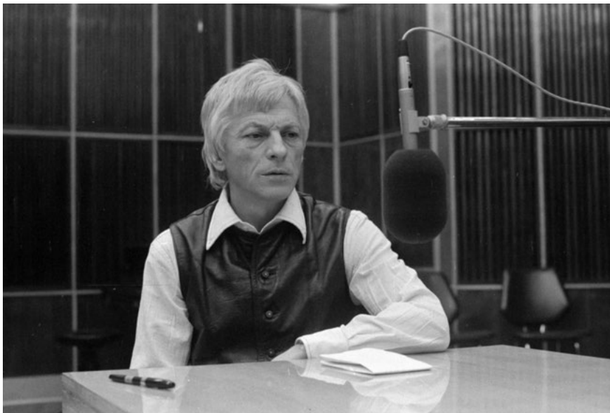
Nagy László költő a Magyar Rádió Kormos István emlékműsorában, 1977-ben.

Mindeközben hihetetlen szómágia zajlott a valóság és az önbecsülés rovására. A megaláztatásra adott válaszban „az ember valódi színvonala tűnik elő” 7 – fogalmazott Hamvas Béla az 1956-os forradalom kapcsán. A hatalom azonban ezt a forradalmat ellenforradalomnak hazudta, és e minősítést nemcsak a nép arcába vágta, hanem – folytatva a megaláztatásra épített uralmi forma gyakorlatát – meg is követelte e hazugság előtt való főhajtást. A magyar társadalmat ezzel „valódi színvonalának” elsumákolására kárhoztatta, a társadalom bűnbe kényszerítését pedig saját rendszerének