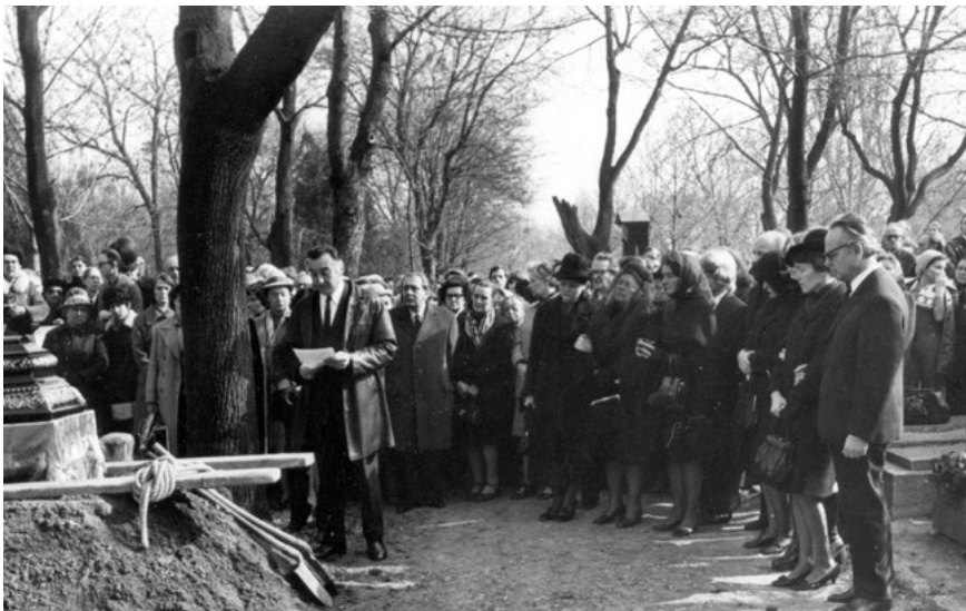
Sinkovits Imre színművész beszél Németh László temetésén, 1975-ben. A háttérben Aczél György.

Fontos tapasztalat volt ez a hatalommal zajló tárgyalás valós lehetőségeiről: „Az MDF alighanem legfontosabb közvetlen előzményének tekinthető az az