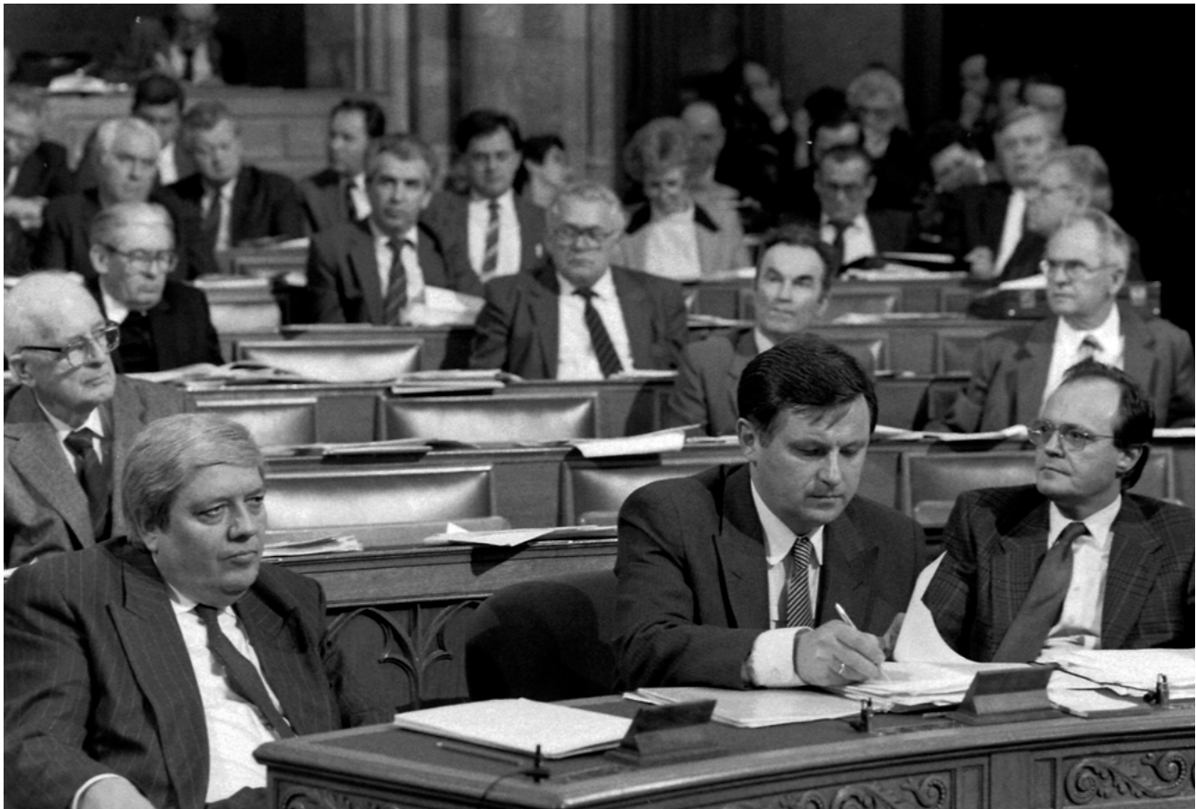
Pozsgay Imre, Németh Miklós és Medgyessy Péter az Országgyűlés alakuló ülésén, 1990-ben.

legfelsőbb köreibben. Egy ilyen változáshoz azonban mind a külpolitikai, mind a belpolitikai konstellációk együttállására szükség volt. Külpolitikai téren, a szovjet szándékokat tekintve, létezett a felismerés és a szándék is a változtatásra. Gorbacsov számára megküldött feljegyzésében Vagyim Medvegyev 1988. márciusában egyebek mellett a következőket írta: „A magyar vezető már nem érzékeli a társadalom és a párt hangulatában bekövetkezett változásokat. [...] képtelen a párt politikájának megújítására, de ezt nem hajlandó elismerni. [...] szükségesnek látszik, hogy [...] mindent megtegyünk annak érdekében, hogy a magyar vezetés a májusi pártértekezletig teljességgel felismerje, mennyire összetett és nagy felelősségtudatot követelő a pillanatnyi helyzet. [...] Megbízható csatornákon keresztül tolmácsolni lehetne Kádárnak azt a véleményt, hogy ez a helyzet semmijót nem ígér, személy szerint neki sem. [...] Egyidejűleg elfogadható formában ki kellene nyilvánítani, hogy politikai támogatást nyújtunk Grósz elvtársnak, és néhány más magyar