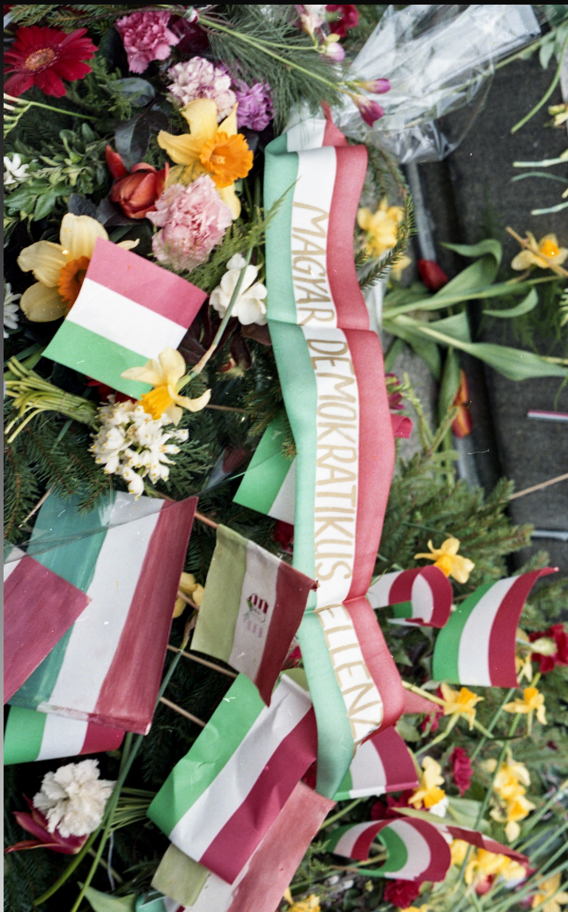
A Magyar Demokratikus Ellenzék koszorúja a Petőfi téri Petőfi szobornál, 1988. március 15.