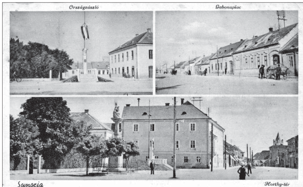
Korabeli képeslap Somorja városáról az országzászlóval

A város főterén egy ideiglenes zászlórúdon félárbócra eresztve felvonták az országzászlót, a tűzoltótestület tagjai és a cserkészek zenészó mellett elvonultak előtte. Somorjának nem volt rá ideje, hogy az ajándékba kapott zászló megérkezéséig méltó zászlórudat és talapzatot csináltasson, ezért a lobogó ideiglenesen ebben a templomban lett elhelyezve. A tápiószecsőiek még az érkezés és a zászlóátadás napján elindultak hazafelé. 16