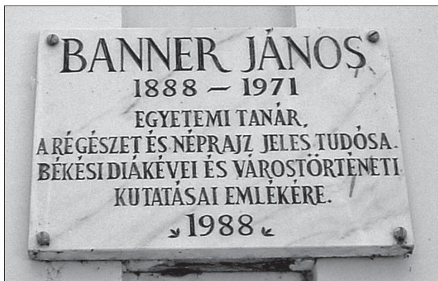
Emléktábla a Nagyház falán