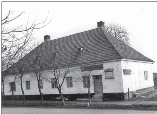
A költő szülőháza az 1960-as években ( http://uraiujfalu.hu/hu/uraiujfalu/hires-szuloitek1 )

nyolc éves lehetett, amikor latint kezdett tanulni a szomszéd falu, Vámoscsalád plébánosától. Kortársainál mindenképpen sokkal változatosabb előképzettségű gyermek volt. Szülei Kőszegre küldték tanulni. Onnan került Sopronba, Szombathelyre, végül Győrbe, ahol jogot tanult. Első versei alig tizennyolc éves korában, 1839-ben jelentek meg a Társalkodóban .