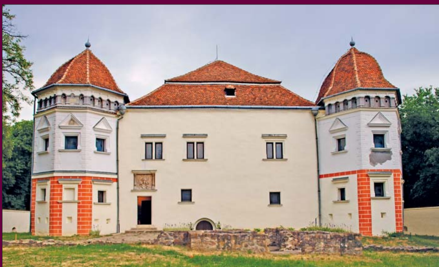
Pácin, a Mágóchy–Alaghy–Senyei-várkastély (Kemecsei Balázs felvétele; a Szerelmes földrajz cikkeihez)