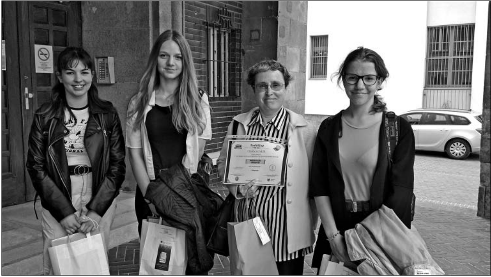
A „Cisztercisták” csapat

A dobogós csapatok az alábbi jutalmakban részesültek mindkét vetélkedő esetében: I. helyezett – ajándéksomag; II. helyezett – könyvcsomag; III. helyezett – 1 éves előfizetés a Honismeret című folyóiratra.