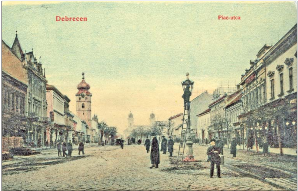
Debrecen régi képeslapokon (A Méliusz Juhász Péter Központi Könyvtár Helytörténeti Részlegének gyűjteményéből)