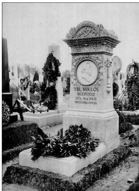
Ybl Miklós síremléke a Kerepesi temetőben (Az Építő Ipar 1891. december 30-i számából)

A legnagyobb jelző került szinte minden halála utáni méltatásában a neve mellé. Az Ország-Világ c. hetilap nekrológiájában ezt olvashatjuk: „Halála igen nagy veszteséget jelent. A fejlődő magyar ipar benne legelső és kétségtelenül legszorgalmasabb művelőjét veszítette el. Ybl széles munkakört és becsülést teremtett az eladdig figyelembe sem vett magyar építészeti iparnak, a melynek legelső sorban van nagy oka arra, hogy agg nesztorának halálát meggyászolja.” 8 Még a mindenkit kifigurázó élclap, a Bolond Istók is egy találó négysoros strófával búcsúzott tőle: