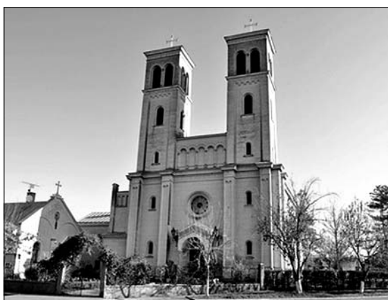
A kaplonyi templom, balra a Károlyiak kriptája