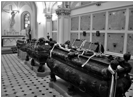
A kriptá belső terme