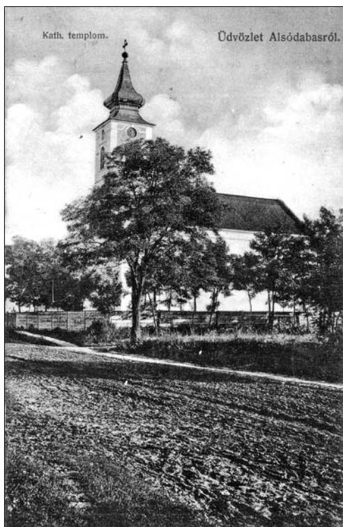
Az alsódabasi római katolikus templom 1909-ben (Korabeli levelezőlap, a szerző gyűjteményéből)

Az alsódabasi katolikus templom impozáns tornya a helyi reformátusokat is döntő elhatározásra bírta, ugyanis az ő templomuk 1793-ban még csak kis toronnyal épült, 18 bár emelésének szükségessége a sok évtized alatt számtalanszor felvetődött. A leghatározottabban és legkitartóbban dabasi Halász Bálint (1775–1858), jó nevű pesti ügyvéd szorgalmazta, aki 1813 és 1818 között a jeles drámaíró, Katona József (1791–1830) principálisaként írta be magát a magyar irodalom történetébe. Halász Bálint 1854. május 22-én kelt végrendeletében külön megemlékezett erről a célról: „ Az alsó Dabasi Reformátusok temploma tornyának magosabb