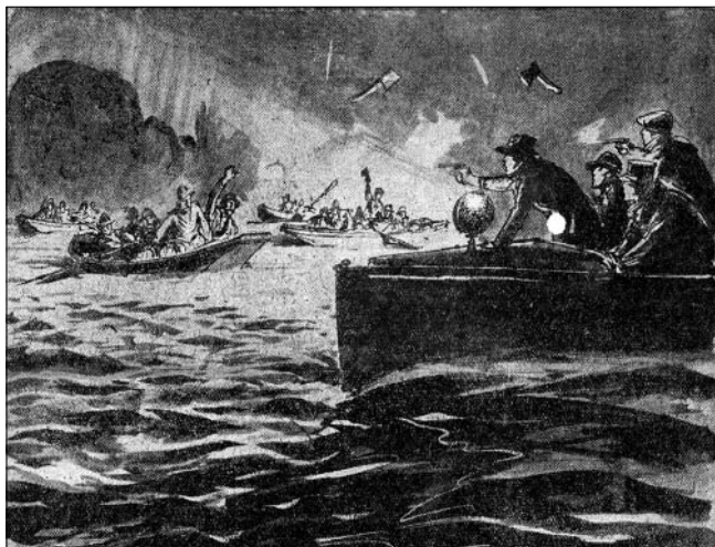
Csempészbanda és detektívek harca a vízen (Friss Újság 1933. július 14. 1.)