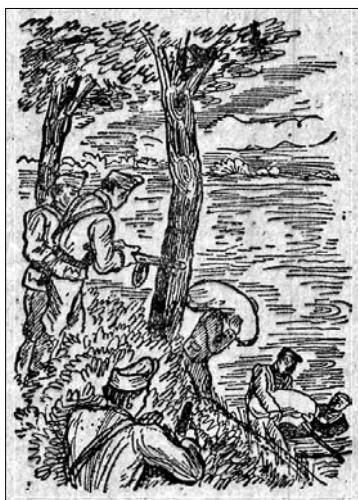
A búzacsempészeket tetten érik a határvadászok (Friss Újság 1947. szeptember 11. 2.)

végkövetkeztetésre jutnánk ma is: csempészsében, üzérkedésben az északi határszél vezet. Ennek több oka van. De az országok viszonylatán, a kedvező terepen túl, a hagyományosság a legdöntőbb. Régi hagyománya van Balasgyarmat, Szécsény és Salgótarján környékén a csempészkedésnek. A gyarmati főutcán tudnak olyan házat mutatni az odaválósiai, amit üzérkedésből, csempészséből építettek. A határmenti falvakban, szinte kivétel nélkül éltek olyan családok, akiknek fő foglalkozásuk a csempészet volt.” 3