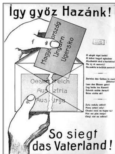
Plakát a soproni népszavazás idejéből ( http://www.sopron.hu/Sopron/portal/show_printableview?id_content=26291 )