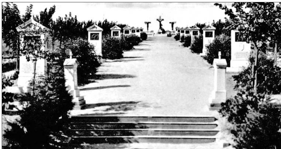
A tihanyi IV. Károly Kálvária egykori képeslapon