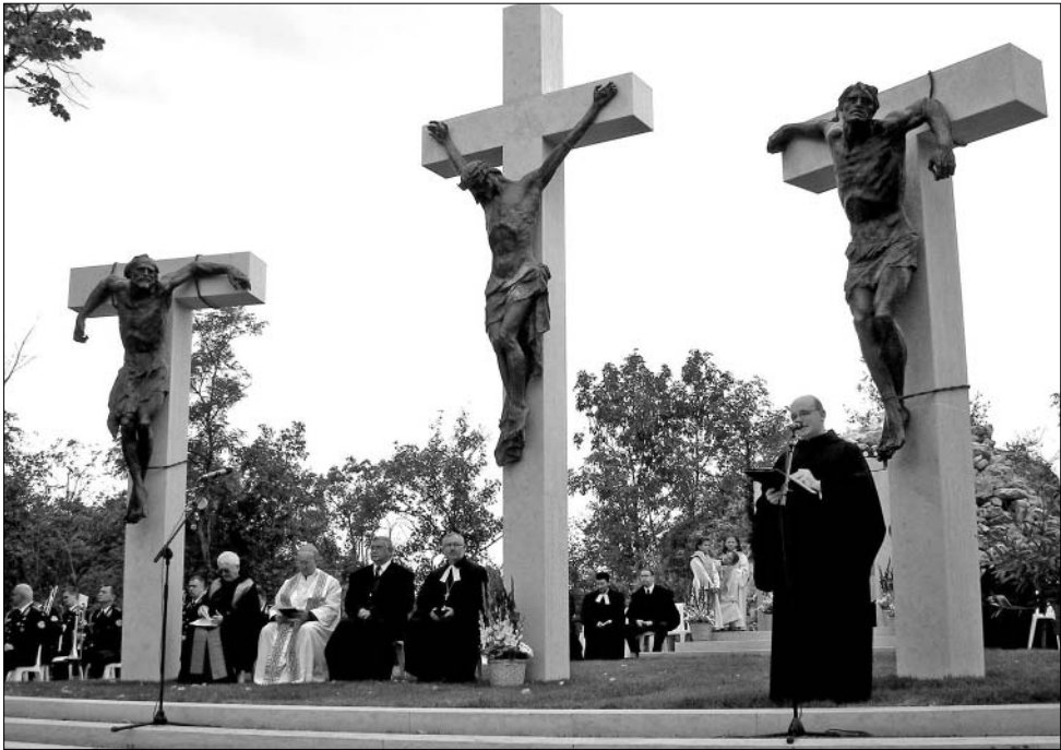
Az újjáépített IV. Károly Kálvária felszentelési ünnepe

kálvária lerombolásáról emlékező naplóját Alberik atya. 12 („ Sokatmondó ” epilógus: a kálvária helyén felszabadulási emlékmű nem épült, még csak tervek sem készültek e célra.)