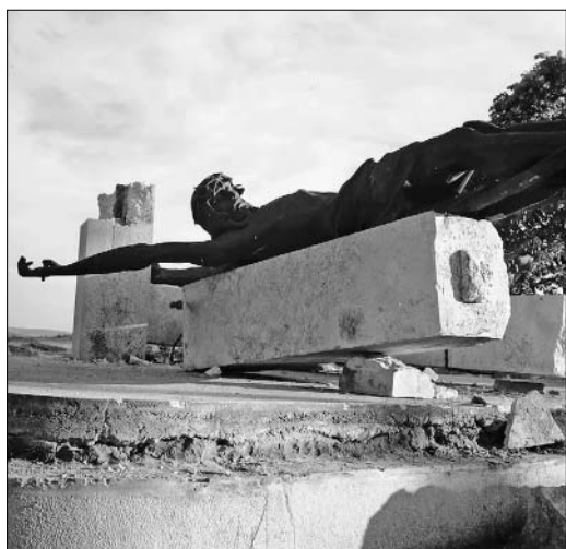
A ledöntött Krisztus-szobor a kálvárián (Vass Sándor Alberik OSB felvétele, 1960; a Tihanyi Bencés Apátság Gyűjteményéből)

erősítettek, s azzal mentek neki az oszlopoknak. Majd következett a kőeresztek ledöntése, melyet a füredi hajógyár darujával tépkedtek ki. „A tihanyi asszonyok egy csoportja letről nézte a pusztítást, szótlánul, dermedten. Egyszer csak hangos zokogásban törtek ki valamennyien” – emlékezett Alberik atya. „Olyan érzése volt az embernek, mintha egy páncélos csata helyszínére került volna. Ráadásul ekkor már nyár volt, turisták százai fordultak meg az apátság környékén. Mind szemtanúi voltak e barbárságnak. A tihanyiak nappal nem mertek, de esténként virágokat hoztak a ledöntött Krisztusra, s megálltak énekelni: »Keresztények sírjatok...!« A néppel sírtunk mi is, papok, meg a kis óvodások. Az ő folyosójukra hordták be ugyanis először a kibontott rézreliefeket s egyre azt kérdezték: »Miért bántják a szegény Jézuskát?« Annyira hatott rájuk a dolog, hogy az óvónénik közbenjárására a helyi tanács elhordatta a szeneskamrájukba, mintha máshol nem akadt volna hely. Onnan vitettem fel később a lakásomba a folyosóra...” 11