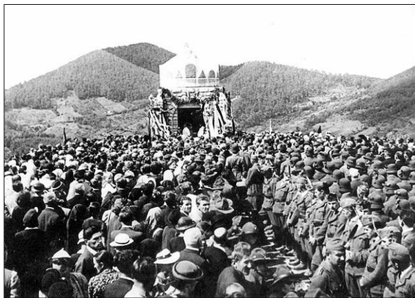
A Szent István-kápolna felavatása 1938-ban ( https://satoraljaujhely.utisugo.hu/latnivalok/magyar-kalvaria-szarhegy-satoraljaujhely-87065.html )

Magyarország patrónájának. A kápolna tervének felmerülésekor motiváció volt, hogy a Szent Jobb országjárásakor itt mutathassák be az ereklyét. Az eredeti tervekhez képest csúszott az átadás, de végül a Szent Jobb is csupán 1939-ben jutott el a városba, mikor is csak a vasútállomás közelében levő sportpályára vitték és ott celebráltak misét. A kápolna őszi avatásán 6–7000 ember vett részt.