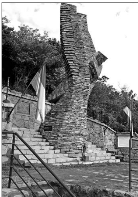
A 2020-ban felállított turulszobor

1945-ben először a háború frontjának ideérkezése okozta óhatatlan – eltévedt lövedékek – és a szándékos pusztítás tette meg a dolgát, '45 után pedig az enyészet volt, ami lassan, de biztosan elpusztította a kálvária stációit, az országzászlót és a kápolnát. Még az emlékműrendszer múltjáról is hallgatni illett a pártállami időkben. Először az internacionalista rendszer szellemisége miatt, később pedig pénz és ismeretek hiányában egészen a '80-as évek végéig nem foglalkoztak a helyreállítással. Azonban a városi tanács ekkor sem az eredeti emlékműveket kívánta újra felállítani, hanem több eltérő koncepció