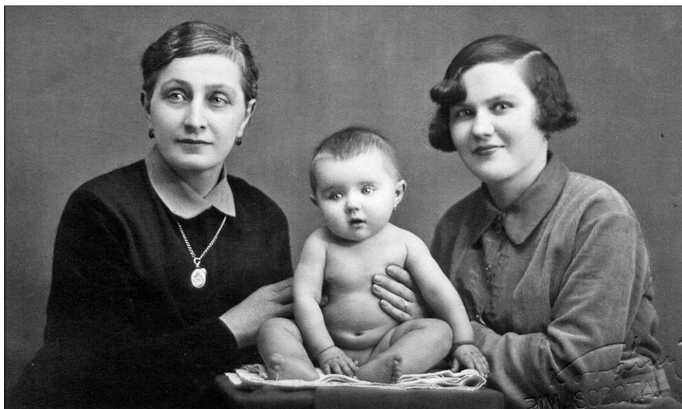
Három generáció Rimaszombatban az 1930-as években: a dédnagyanyám, a nagyanyám és a kisbaba, az anyám

Anyai ágon a Felvidékről származom. Bár az is igaz, hogy anyai dédnagyanyámat szülőhelyétől, Rimaszombattól Aradig, majd Érsekújvárig, végül ismét Rimaszombatig vetette a sorsa, hogy aztán ő és a három lányából kettő – köztük a nagyanyám és családja – a II. világháború után ott kellett hogy hagyják egész addigi életüket. Őket is elérte az áttelepíté-