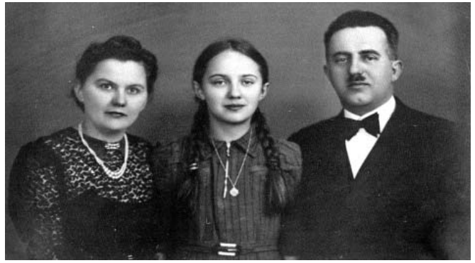
A Paxián család Rimaszombatban az 1940-es években, a nagyszüleim, középen az anyám

A nagyapám 1904-ben született a Csallóközben, a Komárom vármegyei Nagymegyeren. Kaposváron végezte el a kereskedelmi iskolát, itt szabadult fel pincérként 1921-ben. Munkát keresve került Rimaszombatba, dolgozott a híres Három Rózsában is, ahol egészen a főpincérségig vitte. Korán nősült, egy lányuk született. 1938-ban megnyitotta saját vendéglőjét, a Turult, melynek jó híre volt Rimaszombatban. A munkába az egész család besegített, akik a front odaérkeztekor kénytelenek voltak elmenekülni. Mire visszatérhettek, mindenük odalett.