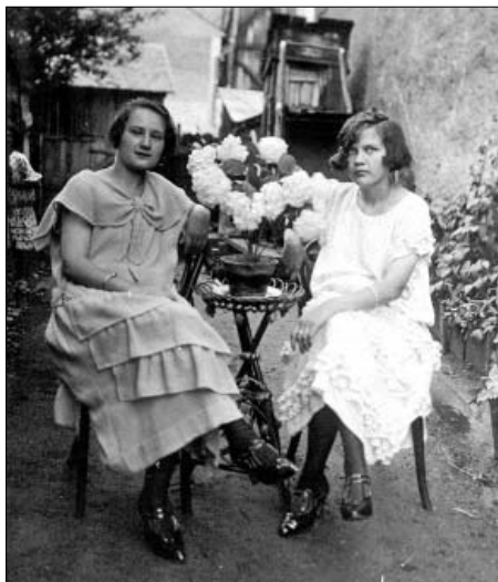
Ketten a rimaszombati kézimunkaműhely udvarán az 1920-as évek közepén, a jobb oldali fiatal lány a nagyanyám

sek keserű kényszere és egy másik ország más-más városaiban, Egerben és Ózdon találták magukat. Az ő és gyermekei életéről sokat tudunk, mondhatom kész regény, amit szinte átszövött az egész múlt évszázad minden öröme és bánata.